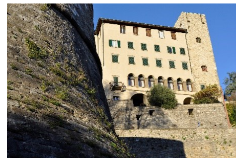
Palazzo Lolmo del Seminario