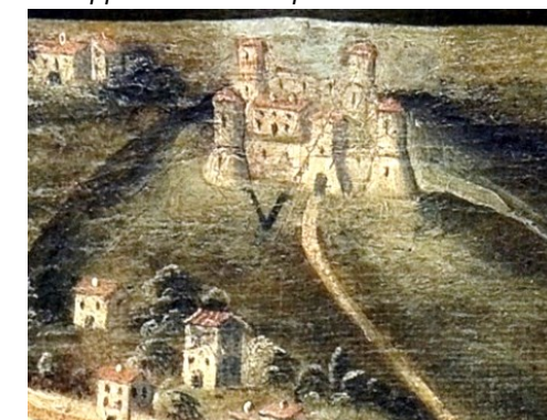
Alvise Cima: particolare del castello di San Vigilio (Tosca Rossi, docet)