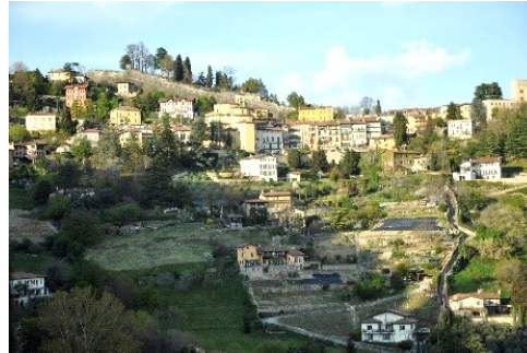
La Conca d'Oro con Fontanabrolo