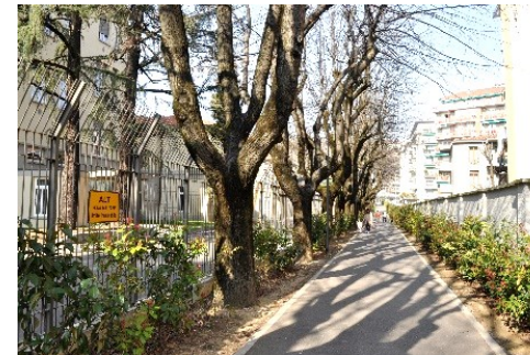
La pedonale del vecchio ospedale

Il Ritorno è previsto in autonomia o in gruppo per Borgo Canale.