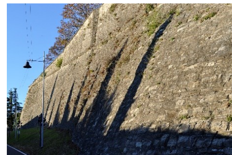
Le Mura del Baluardo di San Giovanni

La scaletta è documentata dal 1590 e è stata interessata da un recupero nel 2019. In rete è presente una relazione tecnica, ma non ci sono particolari riferimenti storici. È presente nel catasto del Lombardo veneto e nella mappa di Bergamo del Manzini (1816).