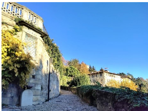
Il bivio con la casa missionaria