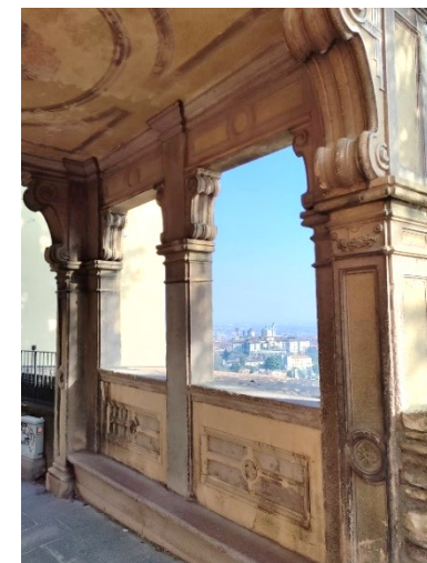
La cappella di Mezzaripa