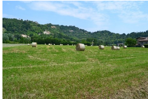
Pascolo dei Tedeschi con Fontana

Abbiamo già proposto una decina di itinerari che salgono al Castello, questo che andiamo a descrivere parte dal piazzale della Croce Rossa, segue la pedonale del vecchio ospedale, poi via Damiano Chiesa e, attraversata la via Alberto Riva Villasanta (patriota deceduto a Paradiso UD!), si arriva alla partenza della scaletta del Paradiso.