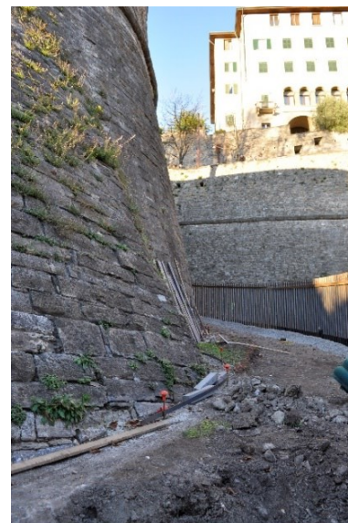
Il cantiere del nuovo passaggio dalla cannoniera di San Giovanni