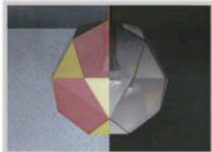
Solido di Archimede: ICOSIDODECAEDRO.