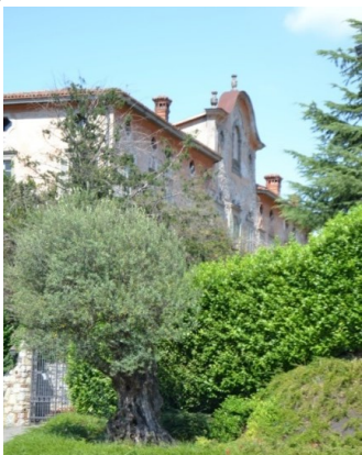
La Villa Malliana

Si ritorna alla rotonda e per via De Gasperi arriveremo a villa Malliana (si attende conferma per la possibilità della visita degli interni).