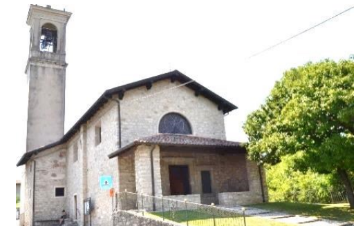
Il Santuario della Madonna della Neve

Si ridiscende verso via Longa utilizzando una scalinata che porta nelle vicinanze di Almenno S. Bartolomeo, che non mancheremo di visitare, con la Parrocchiale di S. Bartolomeo di Tremozia (risale alla prima metà del XV sec. e è stata ricostruita nel XVIII, al suo interno, tra le opere, spiccano la Madonna col Bambino e S. Caterina del Moroni e una Madonna in