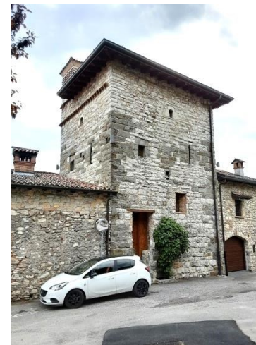
La ben conservata Torre di Carosso

Si prosegue fino alla cresta della collina (cima Longa 414 mslm) dove s'incrociano più vie (una a sinistra porta a Albena), a destra imbocchiamo la via Brigata Partigiani Albena e procediamo fino al Santuario della Madonna della Neve (il percorso è asfaltato ma poco trafficato).