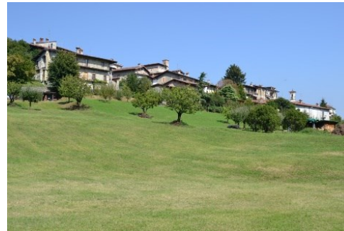
Il borgo di Carosso visto da Palazzago

Dal cimitero di Palazzago seguiremo il sentiero acciottolato della Casella (a destra della cappella dell'Apparizione) che ci porta alla suggestiva frazione di Carosso (Almenno S. Bartolomeo), la località già visitata nel precedente itinerario (un bel esempio di recupero edilizio di costruzioni medioevali: è visibile una torre discretamente conservata e altri angoli di interesse intorno alla Chiesa di S. Margherita.