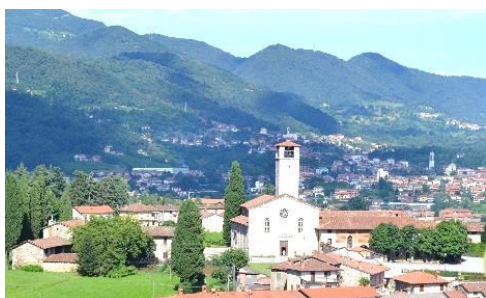
Panorama con il complesso conventuale di S. Nicola di Almenno S. Salvatore (XV sec.)

Nelle vicinanze la Chiesa e l'ex Convento di S. Caterina di Tremozia. L'edificio del 1514 è inserito in un complesso di vari fabbricati, conserva la sua struttura originaria e anche alcuni affreschi, sempre del XVI sec., che rappresentano in sei scene gli episodi della vita di S. Caterina D'Alessandria (la Chiesa fa parte del circuito dell'Antenna Europea del Romanico, ma non è certa la possibilità della visita in questa occasione).