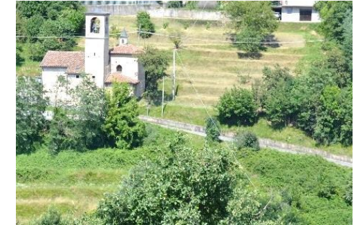
La Chiesa di S. Maria Nascente di Barlino

Si prosegue fino alla cresta della collina (cima Longa 414 mslm) dove s'incrociano più vie (una a sinistra porta a Albena), a destra imbocchiamo la via Brigata Partigiani Albena e procediamo fino al Santuario della Madonna della Neve (il percorso è asfaltato ma poco trafficato).