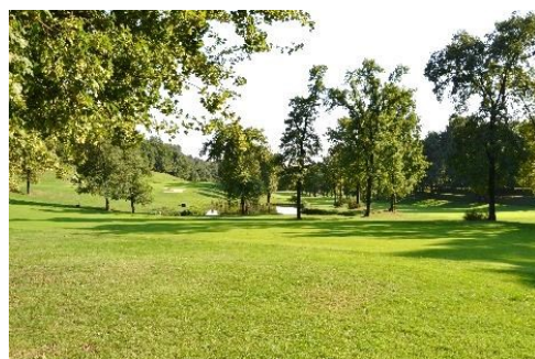
Il Campo di Golf di Barzana

Si deve seguire il percorso principale con salite e discese, zizzagando ai confini dei campi del Golf. Il sentiero termina in via Ca' Morino, si continua a sinistra al confine del Campo di Atterraggio dei Parapendio, dopo un ponte sul corso d'acqua, a destra, parte un elegante percorso che costeggia le nuove abitazioni e il Campo di Atterraggio (via Campo delle Rane), fino al Parco Giochi di Cà Morino. Sulla destra si stacca un sentiero che ci porta a un'ampia strada di campagna, si continua a sinistra in via Cabacaccio, verso l'omonima località, interessante borgo medievale. Pochi minuti e si rientra in