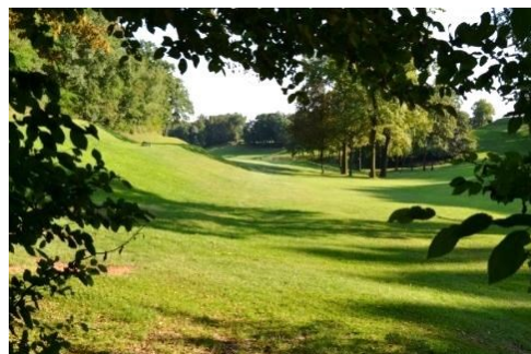
Il Campo di Golf di Barzana

Nel piazzale scendiamo verso il Sentiero del Golf e si procede a destra percorrendolo in direzione nord-ovest, con ampie visioni dei campi nell'interessante bosco di querce.