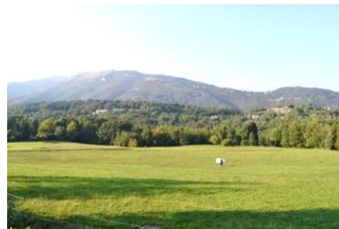
Il Campo di Atterraggio dei Parapendio

Carosso e da lì a sinistra al Cimitero di Palazzago.