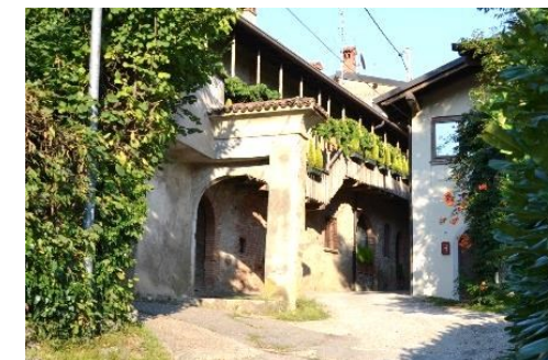
Il borgo di Cabacaccio