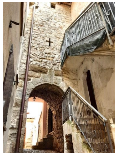
La portatore del Castello di Carosso

Si esce dal centro verso la Parrocchiale, si gira a sinistra in via Carosso e si prende la via del Risòl, alla curva parte un sentiero in acciottolato che sale fino alla via Camoretti (strada del Serrit), si continua nel bosco e si passa alla strada asfaltata (2 Km) superando il ristorante Camoretti.