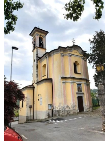
La Chiesa di S. Margherita di Carosso

Si esce dal centro verso la Parrocchiale, si gira a sinistra in via Carosso e si prende la via del Risòl, alla curva parte un sentiero in acciottolato che sale fino alla via Camoretti (strada del Serrit), si continua nel bosco e si passa alla strada asfaltata (2 Km) superando il ristorante Camoretti.