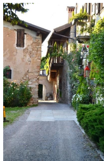
Il borgo di Cabacaccio