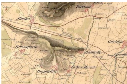
Mapa del 1840

I Comuni di Brusaporto e Bagnatica fanno parte dell'hinterland di Bergamo e distano 12 Km dalla città.