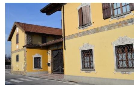
La filanda di Brusaporto

Si continua in direzione del centro abitato fino alla rotonda, si prende a destra per via regina Elena e si gira a sinistra per via Cesare Battisti verso la costruzione della vecchia filanda, ora adibita a cerimonie.