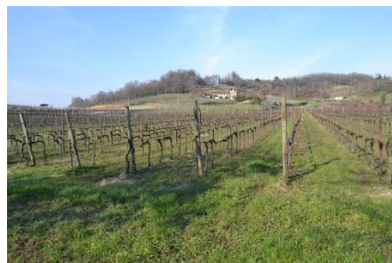
I colli del Tomenone area occidentale

Si continua per via Roma, via Leopardi, poi a destra per via Belvedere, 600 metri e ancora a destra per via Beder, pochi passi e inizia, a sinistra, la ciclabile di via degli Aceri (ciclovia dei laghi Nord/Est).