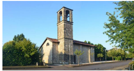
Chiesa di S. Pietro di Mezzate

viva, in parte a conci regolari e in parte a opus incertum attribuibili al XV sec.