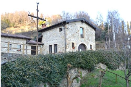
Il casello di s. Marco

Si ritorna al banano e, a destra, un largo sentiero, poi una scalinata e infine una strada cementata vi portano al Casello S. Marco, struttura rurale restaurata dall'Associazione dei volontari di Bagnatica: luogo di socializzazione, recita uno dei tanti i cartelli che si trovano nell'area (tavoli per pic-nic e ristoro). Si prende il sentiero a destra per via Tomenone e si raggiunge Bagnatica: resti di edifici medioevali, cascine, antichi palazzi.