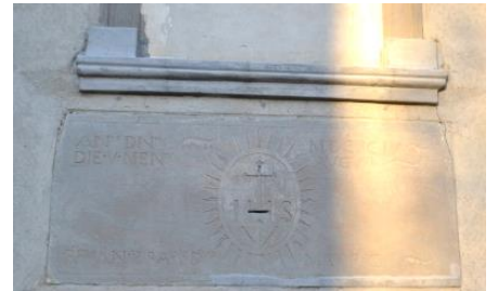
Santella di Bagnatica

Altra deviazione a sinistra verso centri sportivi, dove si osserva la vasca di laminazione: un bacino artificiale posizionato strategicamente per raccogliere l'acqua in eccesso durante le abbondanti precipitazioni; acque che vengono poi rilasciate gradualmente nelle condotte evitando le esondazioni e gli allagamenti. Negli ultimi anni l'area è diventata habitat ideale per la fauna delle aree umide. Da ammirare la coreografia dei rilievi e dei campi che, a secondo della stagione, servono anche da transito alle greggi. Si conclude l'anello continuando sulla pista ciclabile, girando a sinistra per via Cantalupa, sempre dritti fino all'incrocio con la provinciale, a destra c'è un percorso pedonale che vi permette di attraversare la strada in sicurezza e continuare per il passaggio pedonale la Roncaglia , fino al punto di partenza.