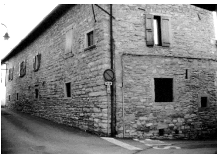
Palazzo fortificato di Bagnatica

Da osservare una serie di case a corte in pietra sviluppatasi attorno ad una torretta d'angolo con fronti in pietra