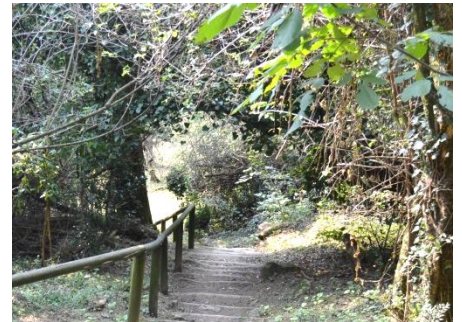
La salita al Tomenone

vitale importanza nei tempi antichi). Alla fine della via trovate una sbarra: lì, a destra, parte il sentiero che s'inerpica sul colle del Tomenone lungo il versante orientale. Percorrete il sentiero principale che sale e scende per un chilometro fino al "fontanino"; poi l'ultimo strappo fino alla sella dove si incrociano vari sentieri (c'è anche un banano come riferimento).