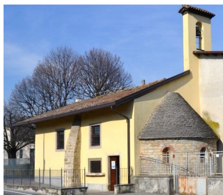
Chiesa di S. Martino a Brusaporto

Parcheggiamo a Brusaporto in via S. Martino per visitare la chiesa omonima.