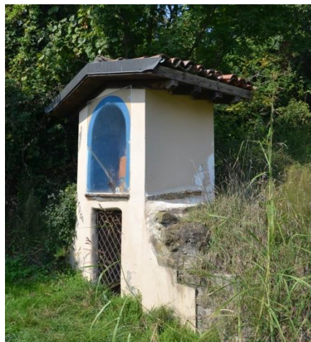
Santella con cisterna alla base del Colle

Girare a sinistra poi a destra per via delle Robinie e infine a sinistra per via delle Querce (pedonale).