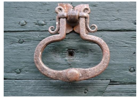
Battacchio di portone a Bagnatica

La villa Belvedere è di origine medievale, monastero, e possiede una caratteristica torre merlata.