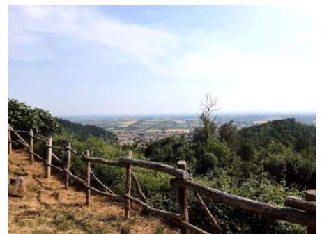
La vista panoramica sulla pianura