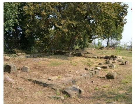
I ruderi del torrione medievale del Tomenone

A destra una scalinata in travi di legno vi porta in cinque minuti alla cima del monte Tomenone con i resti di una torre medioevale e ampia vista sulla pianura. Tra i boschi del colle si trova un antico muro in pietra, forse originariamente costruito per dividere il paese da Bagnatica, e i resti di un posto di guardia con annesso un pozzo ormai prosciugato.