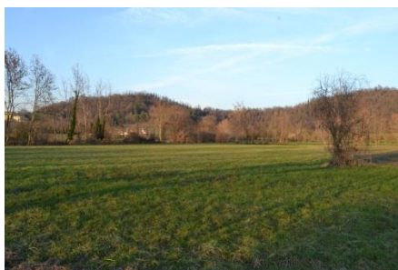
Il rilievo collinare visto dalla piana agricola

L'area pianeggiante è fortemente antropizzata; conserva comunque edifici di interesse storico-architettonico e i rilievi rappresentano isole naturalistiche.