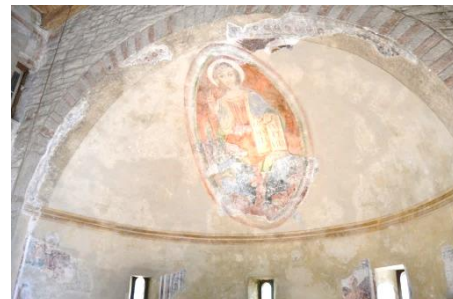
Il Cristo Pantocrator affrescato nell'abside di S. Martino

Lanzichenecci diretti a Roma nel 1527. Sul sagrato sono presenti tre enormi blocchi di pietra che ci ricordano l'antica attività di cava nei colli del Tomenone, che ora il bosco nasconde