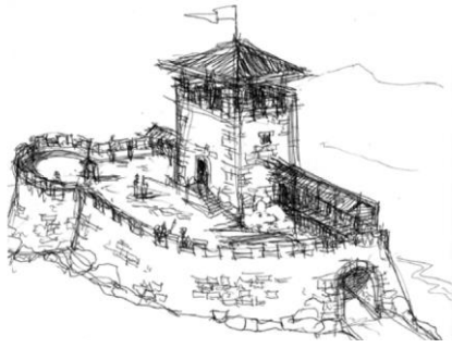
Ricostruzione ipotetica fortilizio del Tomenone