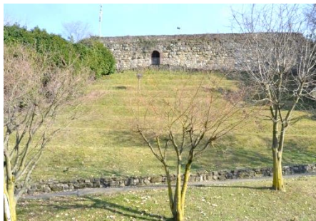
La Rocca del Colle di Brusaporto

Una scalinata permette di arrivare sullo spalto, osservare il panorama sulla pianura e capire le potenzialità del luogo per quanto concerne l'avvistamento; da Brusaporto passava l'importante via romana che da Brescia portava a Bergamo e Como.