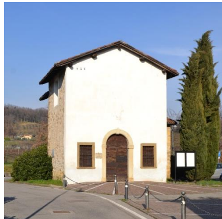
Chiesetta di S. Rocco

Si può uscire dal cancello opposto per scendere nella parte storica di Brusaporto (palazzi, portali, torri mozze). Punto di riferimento la chiesetta di S. Rocco. Nelle vicinanze parte la ciclabile che conduce nella direzione sud-est all'incrocio con la via Cantalupa.