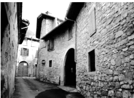
Palazzo fortificato di Bagnatica

Si ritorna al banano e, a destra, un largo sentiero, poi una scalinata e infine una strada cementata vi portano al Casello S. Marco, struttura rurale restaurata dall'Associazione dei volontari di Bagnatica: luogo di socializzazione, recita uno dei tanti i cartelli che si trovano nell'area (tavoli per pic-nic e ristoro). Si prende il sentiero a destra per via Tomenone e si raggiunge Bagnatica: resti di edifici medioevali, cascine, antichi palazzi.