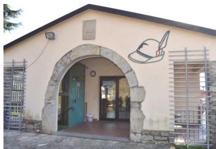
Edificio alla base del Castello di Brusaporto

Girare a sinistra poi a destra per via delle Robinie e infine a sinistra per via delle Querce (pedonale).