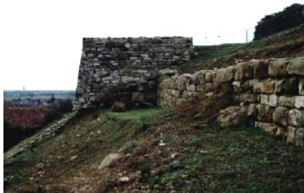
Tratti della cinta muraria medievale della Rocca del Colle