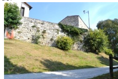
Edifici medioevali al Colle del Niardo

Sempre in via Roma alcuni muri ci ricordano quanto è rimasto delle vecchie Terme del Colleoni. Siamo ora in vista dell'enorme Cupolone della Parrocchiale e, a destra, si sale la Scalinata che ci porta al Colle del Niardo.