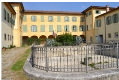
Cortile di Villa Gonzebach

Si esce nel Parco che ci permette di osservare il retro delle strutture. Si ritorna in via Roma. Sulla via sono presenti la Chiesa di San Bartolomeo (nella storia dal 1413) con affreschi del XV sec., il palazzo Scotti-Celati del XVIII° e una cascina antica bisognosa di restauro.