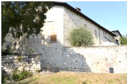
L'edificio medioevale del complesso delle Stanze

La storia di "Trescurium" (toponimo dal X sec.) affonda nella preistoria. Trescore è già stata meta di un precedente itinerario, che riproponiamo visti i numerosi interessi. Rimandiamo, per saperne di più, alla scheda del Maggio 2021 consultabile sul ns. sito. Partiremo dal grande parcheggio con il complesso delle Stanze (dai Grumelli ai Lanzi) con buon restauro.