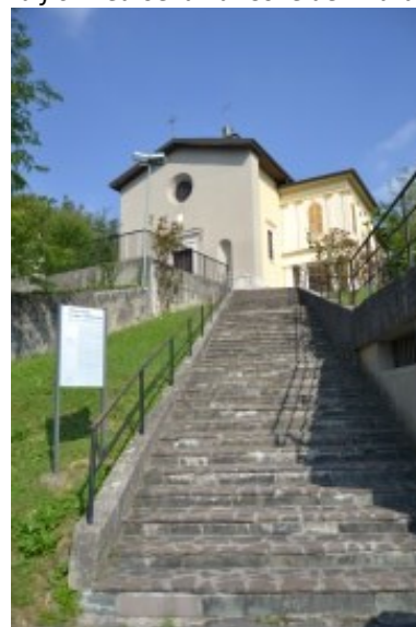
Chiesa al Castello

La struttura antica del Castello è poco visibile (proprietà privata) e sorge sul sedime di un edificio del I sec. a.C. Ben visibile invece la Chiesa della Vergine Addolorata del XVI sec. in cima alla scalinata ( Chiesa al Castello ). Dal colle si osserva il panorama e si intuiscono le potenzialità del Corno.