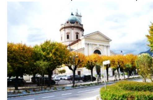
La Prepositurale di San Pietro

Nelle vicinanze c'è la Villa Suardi con i famosi affreschi del Lotto (fuori dall'itinerario).