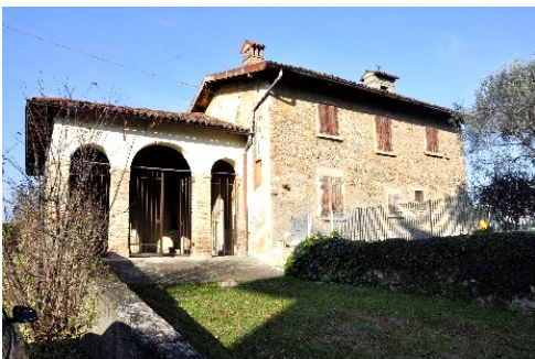
Chiesa di San Siro

Partiremo dalla chiesa romanica di San Siro, con abside e altre rilevanze architettoniche ma con struttura alterata.