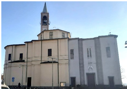
La Parrocchiale di San Gervasio