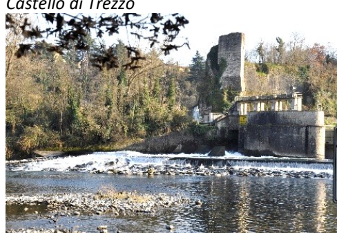
Strutture idrauliche e Torre del Castello di Trezzo