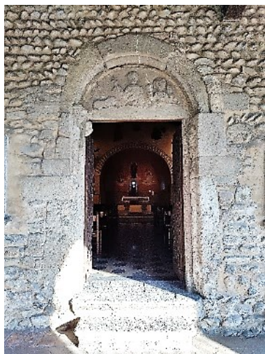
Ingresso della Chiesa di San Siro con lunetta altomedioevale