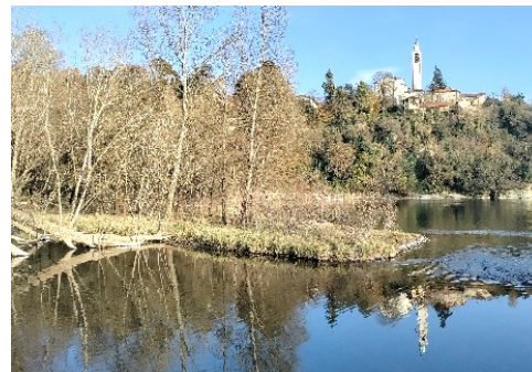
Ansa fluviale con San Gervasio

sito: https://www.castrumcapelle.org Facebook: @castrum capelle contatti: castellodibergamo@gmail.com