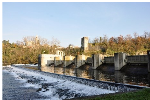
La Diga della Centrale Taccani

informazioni e coordinamento prima e durante l'uscita: 3389213848 - 3406987249