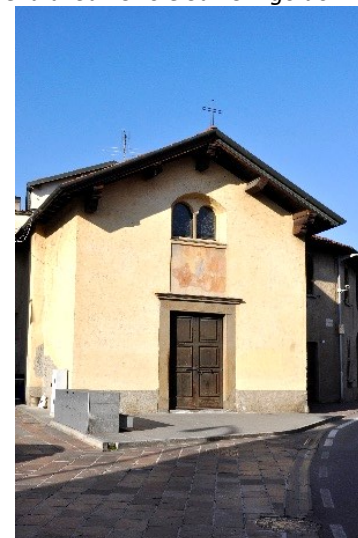
Chiesetta di San Rocco