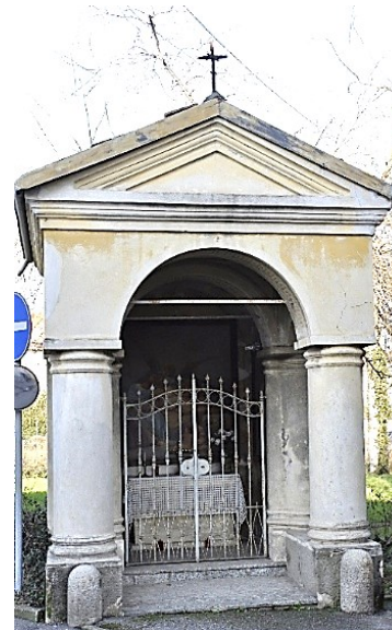
Cappella di San Siro e San Sinigoldo

Torre di Teodolinda e la Torre del Castello di Trezzo. Altre emergenze: il Lavatoio e la Scala di Risalita dei pesci.... Si continua lungo il sentiero sul fiume fino al Fontanile e ritorno al punto di partenza lungo il percorso fatto all'andata.