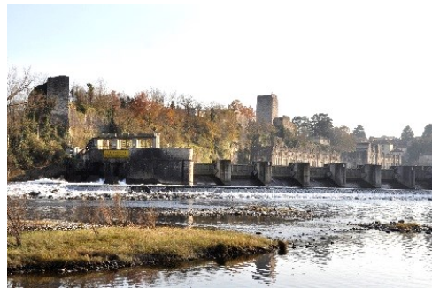
Diga sull'Adda, Torre di Teodolinda e Castello di Trezzo