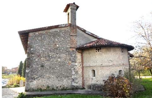
Abside della Chiesa di San Siro

Proseguiremo verso il centro storico, in attesa di un definitivo restauro. In via Trento, la Cappella di San Siro e San Sinigoldo, in via Trieste la Chiesa di San Rocco, Palazzo Colleoni, Palazzo Carminati, ora Biblioteca, e Palazzo Sessa Vitali, con giardino, e altri episodi architettonici fino alla Parrocchiale dei Santi Gervasio e Protasio (documenti dal X sec. e rifacimenti tra l'Otto e il Novecento). Si scende verso l'Adda per arrivare alla Penisola di San Gervasio con scenario fluviale fra i più belli della Bergamasca: il terrazzo fluviale con il paese, l'Ansa, la Diga e, sulla sponda milanese, la Centrale Tacconi con la