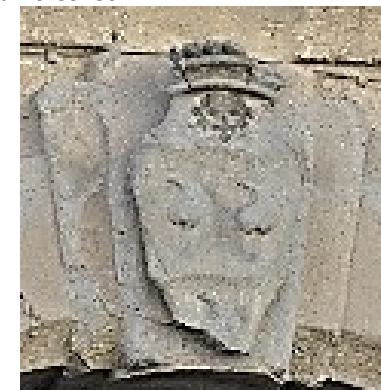
Stemma dei Colleoni

San Gervasòi mangia tigòcc mangia fasòi porselòcc