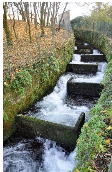
La Scala di Risalita dei pesci