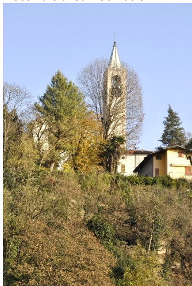
Il Campanile della Parrocchiale di San Gervasio