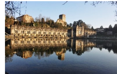
La Centrale Taccani