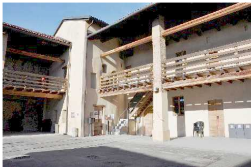
Interno del Castello di Solza