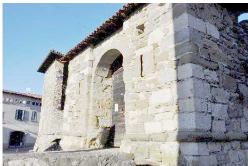
Ingresso del Castello di Solza