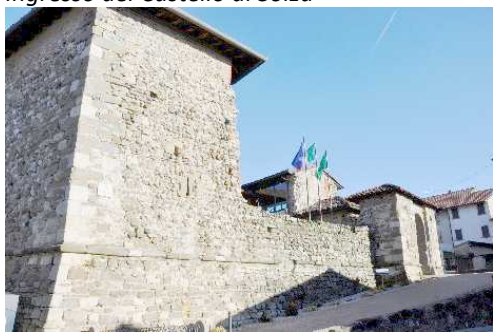
Castello di Solza