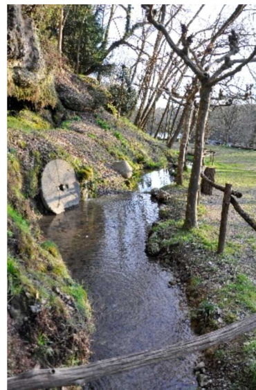
Al Funtani di Suisio