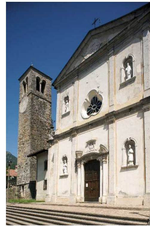
Chiesa di Sottochiesa (UMB_8497 -)