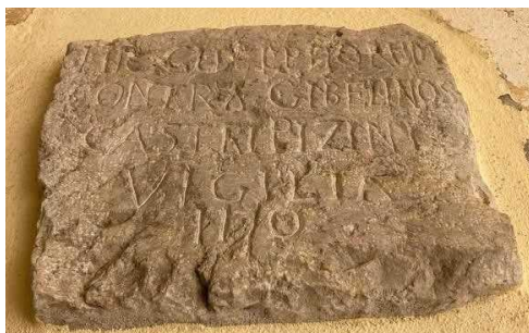
Lapide al Castello di Pizzino