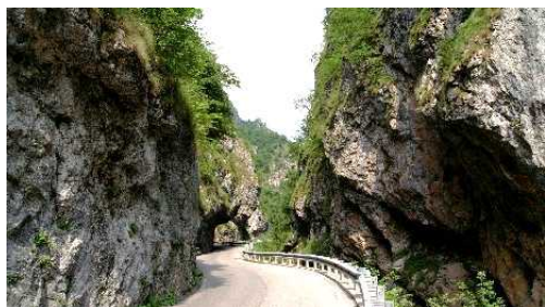
Orridi della Val Taleggio

Dopo aver attraversato la strada che, salendo da San Giovanni Bianco, passa tra i suggestivi Orridi ci troveremo a Sottochiesa (9 km).