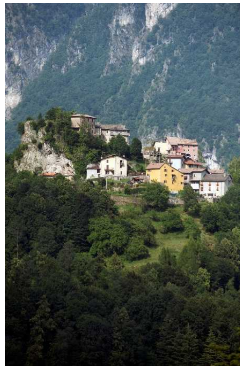
Corna di Pizzino (UMB_7646_ph SPIN 360)

Ore 13:15 Pranzo a base di prodotti tipici presso il ristorante Duca d'Aosta a Sottochiesa di Taleggio.