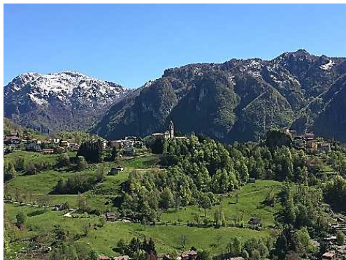
Frazione di Pizzino

A seguire, visita guidata tra i Borghi della Val Taleggio con spostamento con mezzi propri fino alla Frazione Pizzino di Taleggio per una visita guidata alla scoperta della storia locale. In particolar modo alla storica Chiesa con radici millenarie e alla Corna di Pizzino, sulla quale una volta si affacciava il Castello che dominava tutta la Valle.