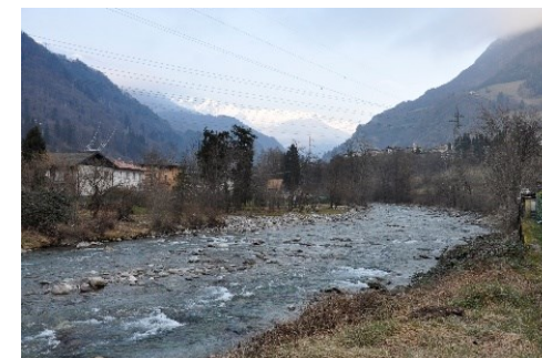
Il Fiume Serio