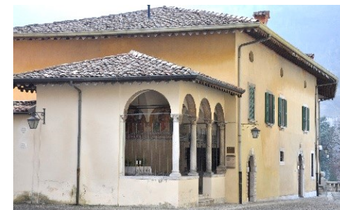
Sacello di San Rocco