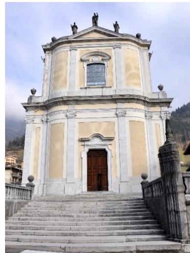
Chiesa Parrocchiale di San Michele

Nel pomeriggio è prevista la visita al MEta, il Museo Etnografico dell'Alta Valle Seriana. Percorreremo l'itinerario giallo lungo il Fiume Serio, con la Chiesa di Sant'Antonio a Zaffalino del XVII sec. e la Centrale Idroelettrica Frua del 1922, per ritornare, sempre lungo fiume, al punto di partenza.