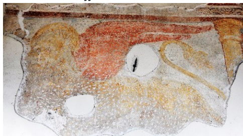
Affresco alla Chiesa dei Santi Pietro e Paolo

A poca distanza la Chiesa Parrocchiale di San Giorgio, del 1725. Nel Sagrato (parte sud) si trova la piccola Chiesa della Confraternita dei Disciplini dedicata ai Santi Bernardino e Giovanni, edificata nel 1622. Addossata al vicino Palazzo, è presente il Sacello dei Santi Rocco e Sebastiano con affreschi quattrocenteschi. Al culmine della Via Locatelli: la Piazza Monte Grappa con l'ex Chiesa di Santa Caterina (tracce di affreschi, e antico Portale d'ingresso), sempre nella