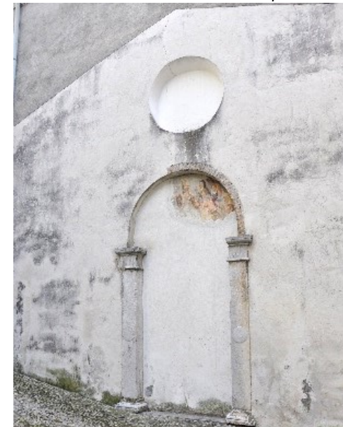
Portale dell'ex Chiesa di Santa Margherita