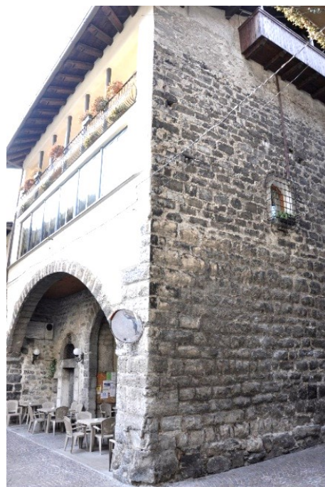
Casa del Vescovo