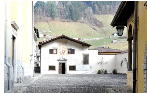
Chiesa dei Disciplini