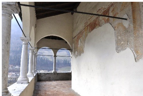
Porticato con affreschi