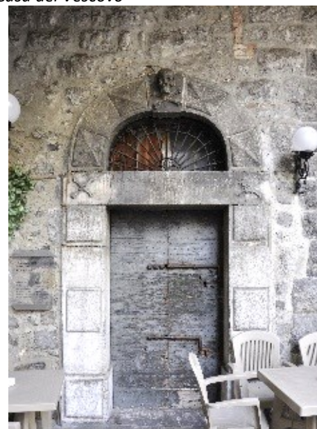
Portale della Cappella dei Morti...con tavolo