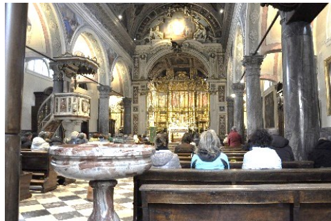
Interno del Santuario