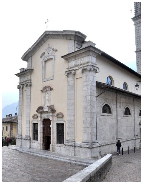
Santuario della Madonna delle Grazie