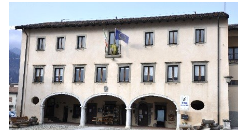
Palazzo Gabaldini ora sede municipale