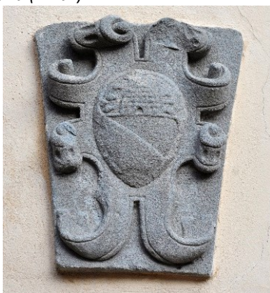
Stemma sulla facciata del Municipio