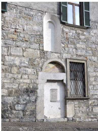
Porta laterale dell'ex Chiesa di Santa Margherita