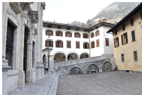
Piazza del Santuario