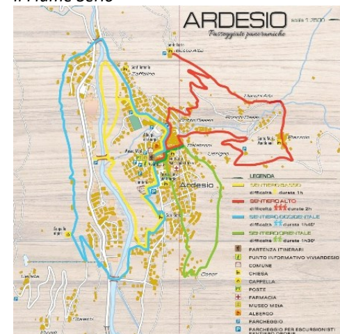
Mappa degli Itinerari dal sito di Vivi Ardesio