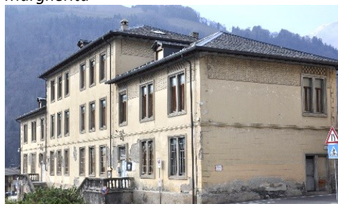
Sede del Museo Etnografico dell'Alta Valle Seriana (MEtA)