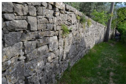
I muri a secco verso Trasio

Ampio panorama con la valle del Fico, S. Pantaleone, la piana e il monte Calvario di Grumello. Si continua per un chilometro in discesa: una croce con gallo v'indica un sentiero a destra, con imponenti muri a secco, che vi conduce, tagliando i tornanti alla frazione Trasio: dopo alcuni edifici antichi, tenendo la destra arrivate in paese e siete di nuovo alla piazza del mercato.