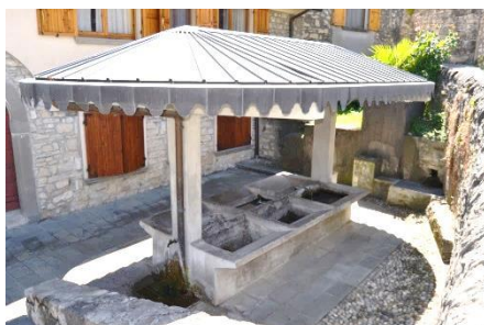
Il lavatoio dei primi del Novecento

Si gira a sinistra e a destra e al lavatoio ci si dirige sull'acropoli di Chiuduno, per via S. Lucio: un borghetto arroccato. A destra il Castello: edificio documentato nel X sec. trasformato fino all'Ottocento, sul portone lo stemma dei Carrara e evidenti strutture del XV sec. sovrapposte a quelle più antiche. Il castello, in origine di proprietà Vescovile, si trova in una posizione militare strategica e dominante, passò ai Suardi nel XV sec. e presenta nel giardino un'antica torre medioevale isolata, del XII sec., in grossi blocchi di pietra lavorati a bugne negli spigoli, dotata di un solo ingresso sopraelevato da terra, mozzata, e in prossimità dei ruderi di un'altra.