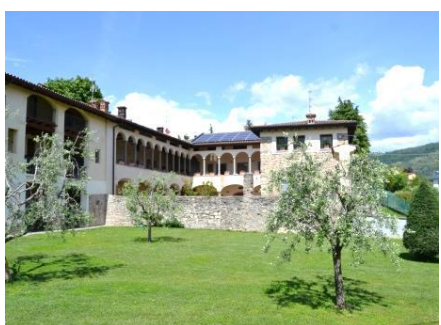
Complesso con loggia e porticato, dietro la chiesa, detto "Ol cantinù".

Continuiamo il cammino dal piazzale del campanile per via dell'Assunta a destra, osservando il bel cascinale con doppia loggia cinquecentesca nella struttura rurale a sinistra.