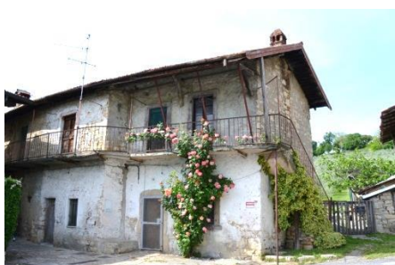
Cascinale in via Montebello

Alle prime costruzioni siete sulla strada del Montebello, si continua e si arriva ad un borghetto poi a destra per 650 m, al secondo bivio girate a destra e continuate per via Montepelato.