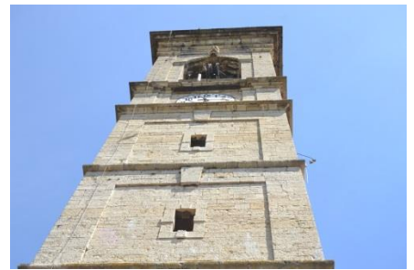
Il campanile di S. Maria Assunta