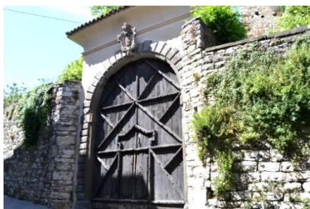
L'ingresso del Castello

Il fortilizio era presumibilmente un castello-recinto visto le muraglie che lo circondano.