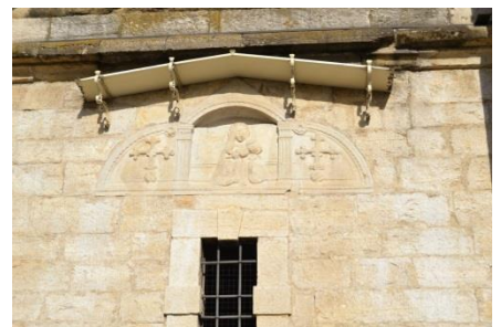
Il frontone trecentesco incastonato nella facciata del campanile