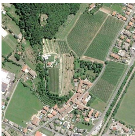
Castello e Villa con Parco Suardo al piede del colle

Nella vicina frazione di Cicola troviamo il Castello, ora Villa Suardo, esempio tipico dell'architettura militare duecentesca con belle muraglie a pietre concie a corsi uguali e bugne a bauletto con gli spigoli vivi, finestrelle a archi ribassati e buche balestriere . E' visibile una torre mozzata nel lato occidentale, una seconda torre in angolo tra due edifici e una portatore cimata con androne di collegamento al borgo.