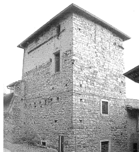
La Torre medievale d'angolo del Castello di Cicola

Bibliografia: Chiuduno di Lionello Gaspari, 2001.