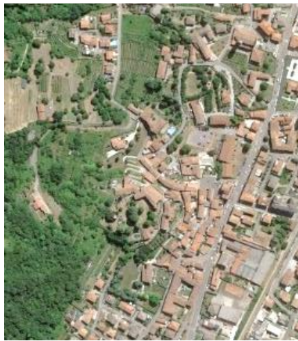
Il Centro medievale arroccato attorno al Castello sulla via di collegamento tra Bergamo e Brescia