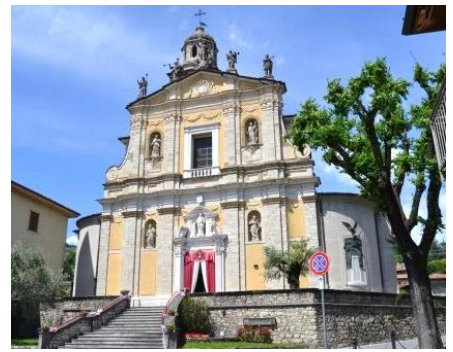
La facciata della parrocchiale di S. Maria Assunta

Partenza dall'ampio parcheggio della piazza del mercato (lungo la strada vecchia per Sarnico, sulla sinistra, superato il centro). Si ritorna verso il centro dirigendoci verso la parrocchiale di S. Maria Assunta, con la sua piazza, la scalinata, il monumentale campanile. La chiesa del 1743, di origine duecentesca e ampliata nell'Ottocento, conserva preziose tele e un monolito di pietra di Zandobbio: un pezzo interessante di provenienza ignota, fatto risalire al X sec., probabile fonte battesimale o mensa ponderale. Il blocco, ritrovato in sacrestia, è ora elevato a altare. Da osservare sul lato ovest del campanile un frontone trecentesco che probabilmente faceva parte della più antica chiesa di S. Maria de Lorino.