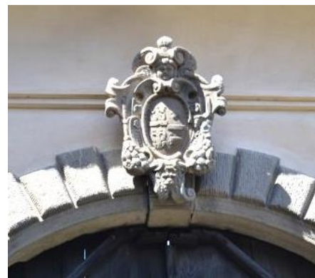
Lo stemma dei Carrara