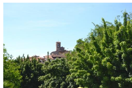
Il Borghetto con la Chiesa di S. Michele

Si ritorna al Castello, si supera il portone d'ingresso e si entra a sinistra nel cancello per visionare la facciata est dell'imponente costruzione, un passaggio coperto ci permette di continuare e imboccare a sinistra del caseggiato, il percorso collinare.