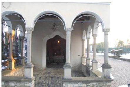
Oratorio di S. Carlo presso il Camposanto

Altre emergenze di Chiuduno (non oggetto di visita).