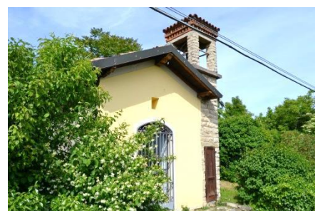
Chiesetta di S. Michele al Borghetto

Pochi passi e siamo alla chiesa del cinquecento di S. Michele, trasformata nel novecento, che racchiude una Pietà del Fantoni.