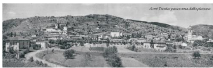
Foto panoramica degli anni '30