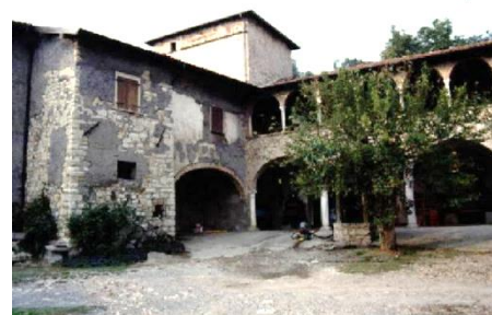
Castello Suardo a Cicola con il loggiato aggiunto nel XVI sec.

Il Castello risale al XIII sec. e la Villa al XVIII sec. I Suardo sono un'antichissima famiglia Ghibellina che presidiava con i suoi fortificati tutta la zona.