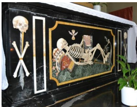
L'altare dei Morti nella parrocchiale

Continuiamo il cammino dal piazzale del campanile per via dell'Assunta a destra, osservando il bel cascinale con doppia loggia cinquecentesca nella struttura rurale a sinistra.