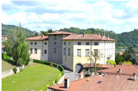
Villa Goltara con la torre medioevale

Procediamo in via XX settembre incontrando l'ottocentesca Villa Ortensia, e, più avanti, la Villa Goltara che racchiude un edificio medioevale, struttura imponente ma poco visibile (deviazione a destra per osservare la facciata nord che ingloba una torre legata presumibilmente al sistema difensivo del Castello).