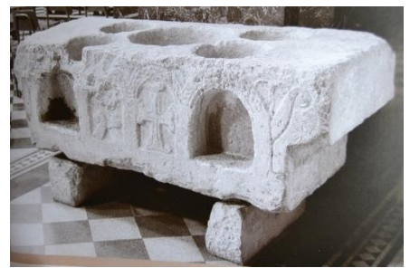
Il monolito medievale con le conche ora adibito ad altare