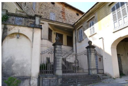
Strutture annesse al Castello

Alle prime costruzioni siete sulla strada del Montebello, si continua e si arriva ad un borghetto poi a destra per 650 m, al secondo bivio girate a destra e continuate per via Montepelato.