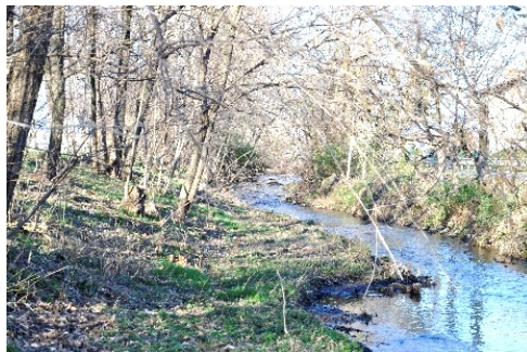
Il rio Morla

Superati i campi sportivi, hanno inizio i nuovi tracciati; a destra si può raggiungere Stezzano lungo la via Castellana, a sinistra, sottopassata la circonvallazione, il percorso ci porta all'incrocio con la via Stezzano sul sedime dell'antico tracciato del cardo massimo romano. Superata la strada, la ciclopedonale ci porta nei territori di Comun Nuovo, insediamento sorto dal 1250 per accorpamenti di terreni di Zanica, il "Pratum Novum di Vezzanica" con altri dei paesi limitrofi. Nasce il nuovo comune con Castrum e grazie alla presenza della roggia Morla. Il percorso si sposta a ponente e, in mezzo ai campi, si raggiungono la chiesa di San Zeno e la cascina Benaglia, che attende il suo recupero.