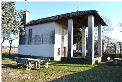
La chiesa di San Zeno

Superati i campi sportivi, hanno inizio i nuovi tracciati; a destra si può raggiungere Stezzano lungo la via Castellana, a sinistra, sottopassata la circonvallazione, il percorso ci porta all'incrocio con la via Stezzano sul sedime dell'antico tracciato del cardo massimo romano. Superata la strada, la ciclopedonale ci porta nei territori di Comun Nuovo, insediamento sorto dal 1250 per accorpamenti di terreni di Zanica, il "Pratum Novum di Vezzanica" con altri dei paesi limitrofi. Nasce il nuovo comune con Castrum e grazie alla presenza della roggia Morla. Il percorso si sposta a ponente e, in mezzo ai campi, si raggiungono la chiesa di San Zeno e la cascina Benaglia, che attende il suo recupero.