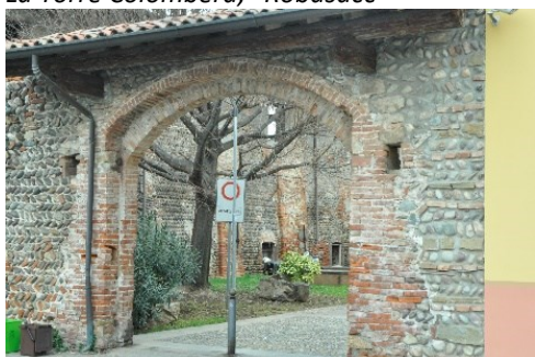
Ingresso dello Stallo Giambarini, "Aie"

informazioni e coordinamento prima e durante l'uscita: 3389213848 - 3406987249