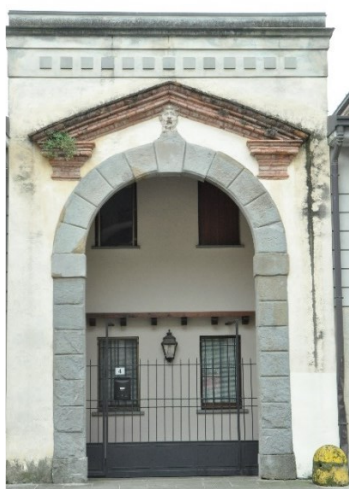
Portale dello Stallo Benaglio