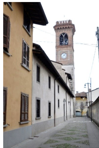
Campanile e Vicolo Chiesa