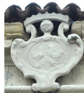
Stemmi dei Benaglio