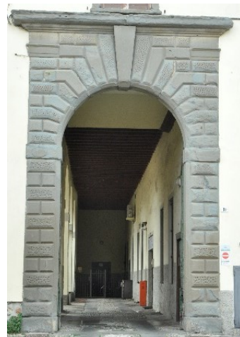
Portale di Palazzo Camera

Ci si sposta nel centro abitato con il Palazzo Camera (ex Albani) e la Villa Benaglia (poi Giambarini). Sono riconoscibili frammenti di architetture: le antiche Mura con la Porta Giambarini, la Torre Colombera e notevoli tracce nella torre medioevale trasformata in Campanile. Numerosi gli emblemi araldici di Casa Benaglia mentre altre strutture erano legate all'antico opificio. Nella parrocchiale dedicata al Santissimo Salvatore è presente, tra le varie opere, una Pala del Moroni. Accanto troviamo la Chiesina dell'Addolorata.