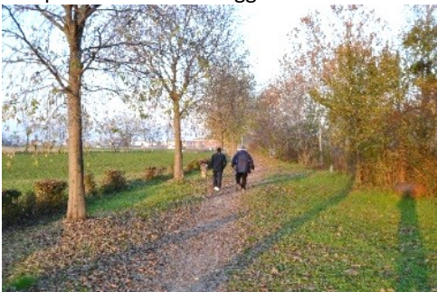
La pedonale lungo il Morla

La partenza è da Zanica, meta di un precedente itinerario. La Villa Comunale, ex Spasciani, e il suo Parco ci danno il benvenuto. Il percorso si sposta verso il nuovo insediamento del Campus dell'Albino-Leffe, lungo una pedonale che costeggia il Rio Morla.