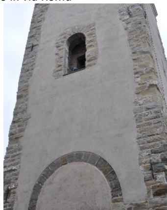
Strutture medioevali nel Campanile