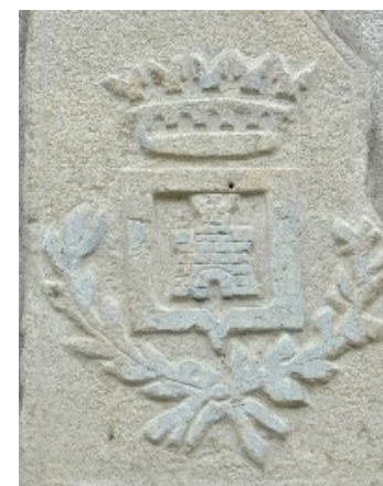
Stemma di Comun Nuovo