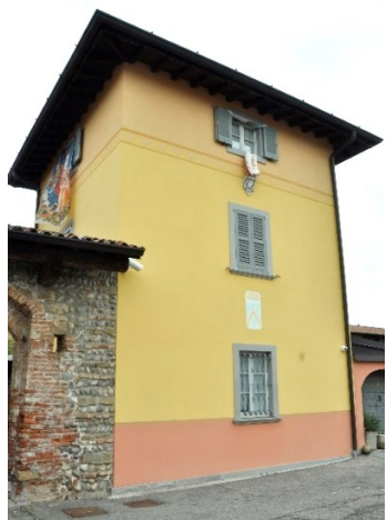
La Torre Colombera, "Robasacc"

L'area percorsa ricade nel Parco Agricolo del Morla e delle Rogge e... ci sarebbe tanto altro da illustrare.