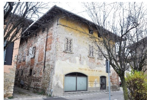
Edificio in via Roma