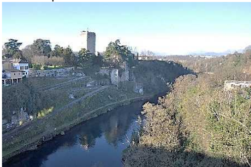
Dal Ponte Trezzo-Capriate S.G. (verso nord)