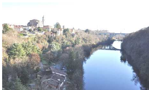
Dal Ponte Trezzo-Capriate S.G. (verso sud)

Si ritorna sui nostri passi, verso il Centro Storico di Capriate d'Adda. All'inizio della via il particolare palazzo del Ciglione della famiglia Nocera del 1927, più avanti una breve deviazione per la Via della Fonte che ci riporta in Piazza della Vittoria con l'edificio Comunale e lo storico palazzo della Famiglia Morali. Accanto la Parrocchiale di Sant'Alessandro dalla lunga storia (terminata con l'intervento novecentesco dell'ing. L. Angelini), accanto la Chiesina che conserva alcuni affreschi provenienti dalla Chiesa della Fonte e, staccato, il Campanile settecentesco.