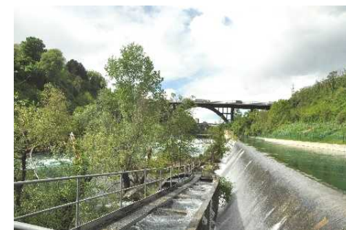
Scala di risalita per l'Ittiofauna