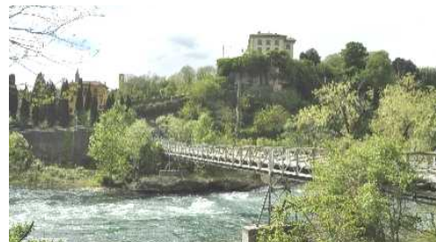
Passerella pedonale per Concesa

il portale della chiesa) e un'altra interessante Villa tardo ottocentesca. Altro panorama fluviale con la Villa Gina di Trezzo. Non mancheremo la visita al Santuario di Concesa sulla sponda opposta utilizzando il Ponte Pedonale (meta di precedenti uscite). Si sale verso il Villaggio Operaio di Crespi (che non ha bisogno di presentazioni). Visiteremo, se i tempi lo permetteranno, la Chiesa di Santa Maria realizzata alla fine dell'800 (copia della Chiesa trecentesca di Santa Maria di Piazza di Busto Arsizio). Uno sguardo all'antico Lavatoio in restauro e saliremo al punto panoramico. Ritourneremo per Via frà Galdino, utilizzando, se le condizioni lo permetteranno, il particolare percorso che passa sotto le strutture del Ponte dell'Autostrada.