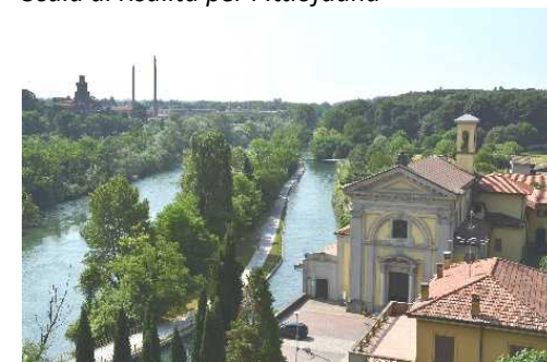
Il Naviglio Martesana e il Santuario di Concesa