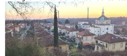
Crespi d'Adda al tramonto

[Scheda a cura di Gigi Nava con il contributo di Pier e Danilo]