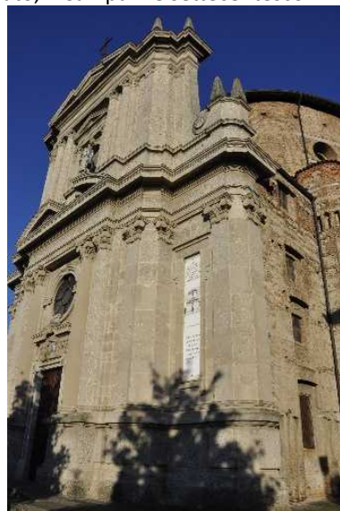
Parrocchiale di Capriate d'Adda

Si ritorna sui nostri passi, verso il Centro Storico di Capriate d'Adda. All'inizio della via il particolare palazzo del Ciglione della famiglia Nocera del 1927, più avanti una breve deviazione per la Via della Fonte che ci riporta in Piazza della Vittoria con l'edificio Comunale e lo storico palazzo della Famiglia Morali. Accanto la Parrocchiale di Sant'Alessandro dalla lunga storia (terminata con l'intervento novecentesco dell'ing. L. Angelini), accanto la Chiesina che conserva alcuni affreschi provenienti dalla Chiesa della Fonte e, staccato, il Campanile settecentesco.