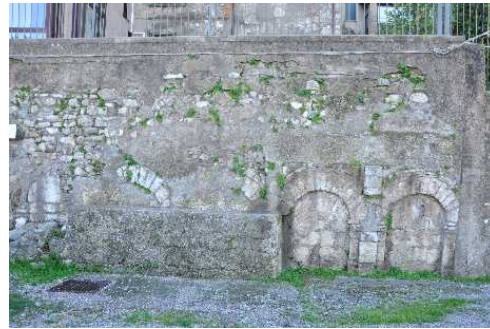
Resti della Villa Romana