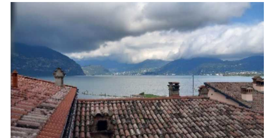
Il Sebino