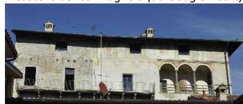
La loggia della facciata meridionale del Castello

Due passi e siamo sulla Provinciale con saluto alla novecentesca Parrocchiale dedicata a Cristo Re, mentre i ristoranti ci ricordano che Clusane è il paese della Tinca al forno , la specialità locale.