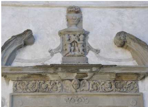
Portale Rinascimentale della Chiesa Vecchia

sito: https://www.castrumcapelle.org Facebook: @castrum capelle contatti: castellodibergamo@gmail.com