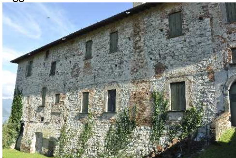
Facciata occidentale del Castello

Nel grande spazio fronte lago, una Scalinata ci permette di salire e osservare, a sinistra, le strutture esterne del Castello detto del Carmagnola , con quello che rimane dell'Ingresso Levatoio, mentre a destra una bella Villa in stile eclettico. Si entra nel Centro Storico: vista dell'altro lato del Maniero con loggia e affreschi.