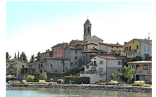
Il Centro Storico di Clusane