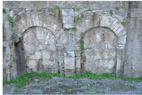
Archi della Villa Romana