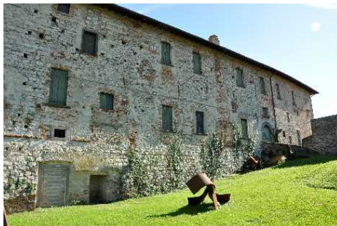
Facciata con ingresso del Castello