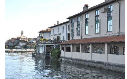
Strutture della Vecchia Filanda