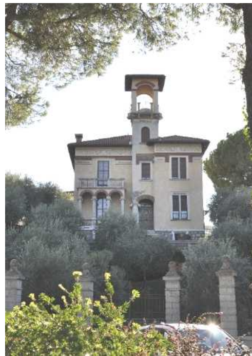
Villa in stile eclettico