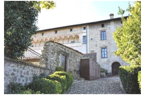
Ingresso al Castello