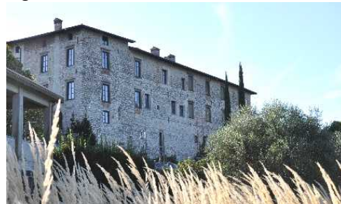
Facciata del Castello fronte lago

Eccoci al Porto, saliamo per via Ponta per osservare altre strutture castellane con altro Ingresso.