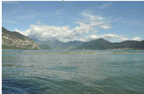
Il Sebino meridionale

Percorso di pochi Km, nel centro nel paese. Clusane è una bella e tranquilla frazione di Iseo che si affaccia sul Lago Sebino, posta lungo la strada che da Paratico porta a Iseo. L'elemento più importante è quello ambientale con il Lago, ma non mancano importanti interessi storico-architettonici. Dal Parcheggio scenderemo per Via San Rocco con l'omonima Chiesetta, pochi passi e siamo al Porto; il panorama giustifica la visita, con Predore, il Monte Corno, Monte Isola, Iseo e il Monte Guglielmo... Il Pontile ci permette di... entrare ...nel Lago.