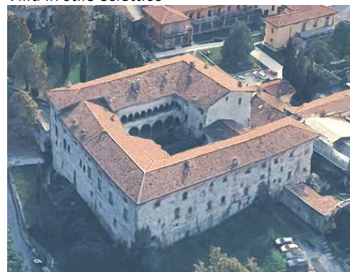
Il Castello del Carmagnola (da Google Heart)