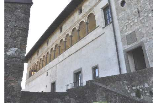
La Loggia del Castello

Da lì la passeggiata verso la Punta a Est con altro Pontile e la vista di Sarnico. Lungo il tragitto le strutture della Vecchia Filanda: spettacolare il panorama.