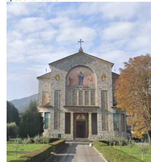
La Nuova Parrocchiale

Due passi e siamo sulla Provinciale con saluto alla novecentesca Parrocchiale dedicata a Cristo Re, mentre i ristoranti ci ricordano che Clusane è il paese della Tinca al forno , la specialità locale.