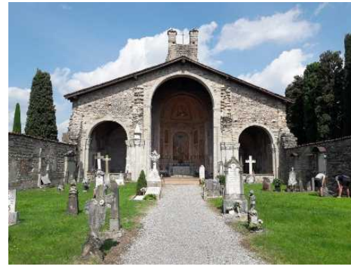
La Chiesa di Santa Giulia