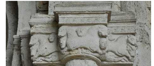
Uno dei Capitelli di Santa Giulia

Ricordiamo Lesina ( Lisina ) a sud di Santa Giulia, abitato romano ormai scomparso, la località Torre, Villa Mulini di Sopra e, fra i ritrovamenti, due Epigrafi Romane ritrovate nelle vicinanze della parrocchiale.