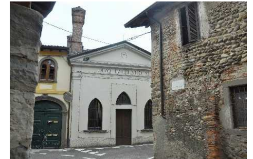
La Chiesa di San Lorenzo

Pochi passi e siamo nel Centro Storico di Bonate Sotto con la nuova Parrocchiale novecentesca del Sacro Cuore, in stile neogotico, e, più avanti, l'antica Chiesa Parrocchiale di San Giorgio e il Palazzo ottocentesco ora sede comunale.