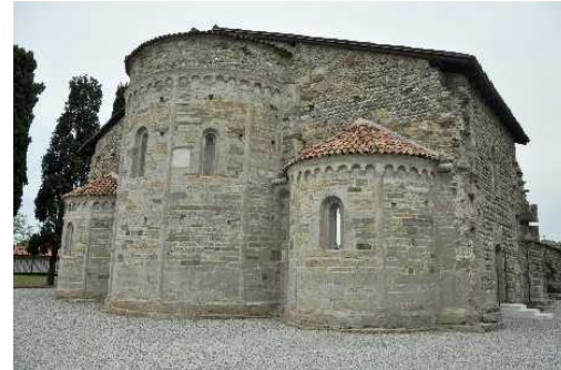
Le Absidi romaniche di Santa Giulia