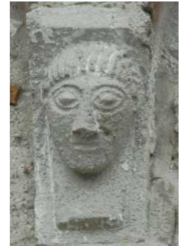
Un rilievo figurato in Santa Giulia

Castrum Capelle ETS: 163958 (26/01/2026)