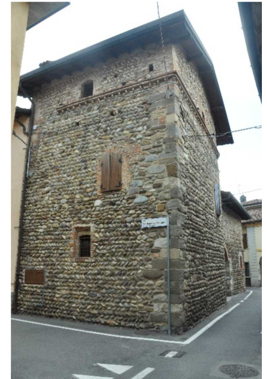
La Torre di Mezzovate