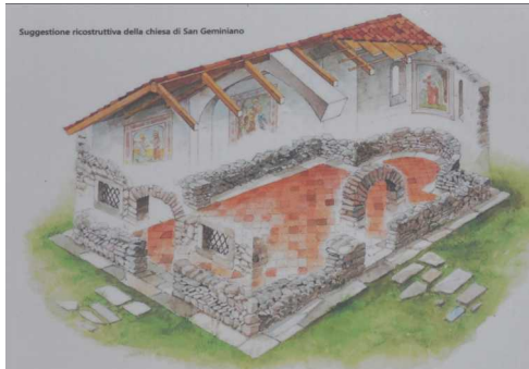
Ricostruzione ipotetica della Chiesa di San Geminiano

Ritornati al Cimitero, un'altra campestre ci permette di continuare sulla Scarpata in direzione di Bonate Sotto (siamo sopra la Galleria della Statale, sono presenti edifici per l'aerazione). Si procede lungo la Via San