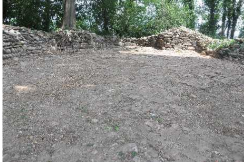
I Ruleri della Chiesa di San Geminiano