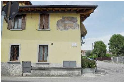
La Via dei Mille

Percorreremo Via Carsana delle Ghiaie piegando per Via dei Mille, dove è visibile un edificio con affresco, probabile sede di un Mulino o Torchio: sono presenti alcune macine incastrate nei muri.