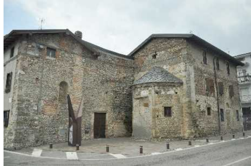
Il Compleanno romanico di San Giuliano

Chiesetta delle Apparizioni del 1944, e in pochi passi raggiungiamo il Parcheggio delle Ghiaie.