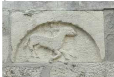
L'Agnello incastonato nel Campanile