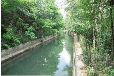
La Roggia Masnada

sterrata nei campi porta all'Area Archeologica della Chiesa romanica di San Geminiano, posta su un'antica strada.