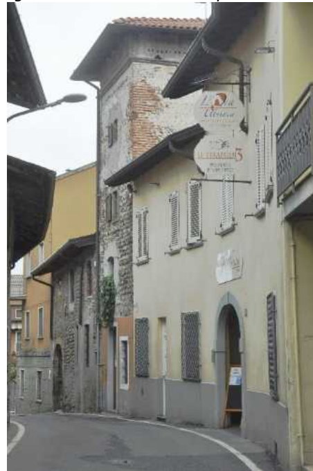
La Via Santa Giulia