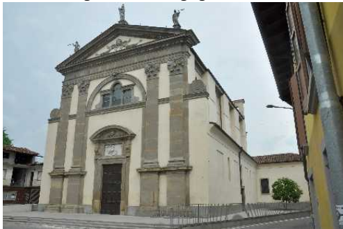
La Chiesa di San Lorenzo