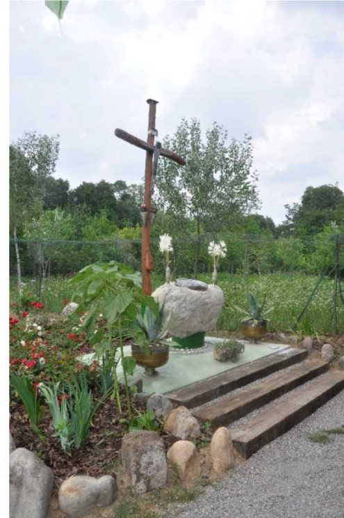
L'altare dedicato a San Quirico

Il Borgo presenta un'interessante Torre del XII sec., alcuni Portali, strutture rurali e una Villa settecentesca (un antico Frantoio) oltre alla Chiesa cinquecentesca di San Lorenzo.