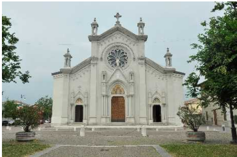
La Parrocchiale del Sacro Cuore, progettata in stile neogotico dall'ingegnere Elia Fornoni