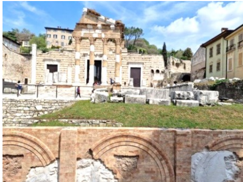
Tempio Capitolino da piazza del Foro

Sulla stessa piazza merita la Chiesa Santa Maria della Carità che rappresenta uno dei migliori esempi del barocco lombardo.