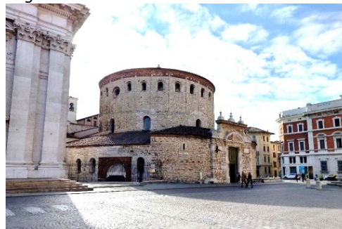
La Rotonda del Duomo Vecchio