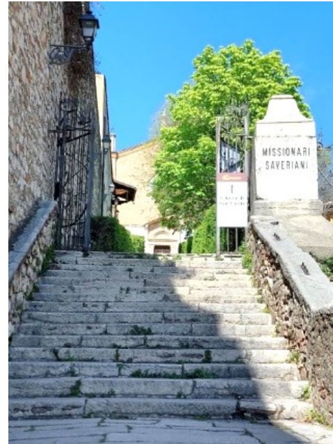
Salita per la Chiesa del Santo Corpo di Cristo

Nel refettorio del Convento si ammira l'ultima cena del Romanino.