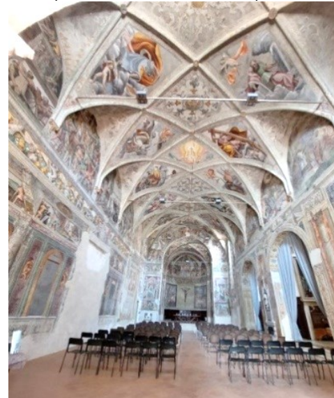
Cappella del Santo Corpo di Cristo