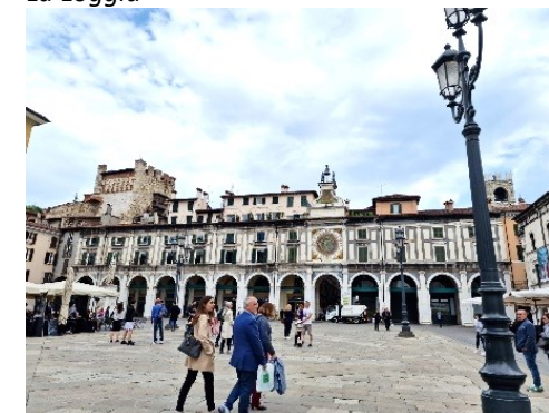
Piazza della Loggia con portici e Torre dell'Orologio

Da piazza della Loggia ci si sposta in via dei Musei che segue il tracciato del decumano massimo . Al n. 30 il Palazzo Martinengo Cesaresco (ospita la mostra di Lotto, Romanino Moretto, Ceruti).