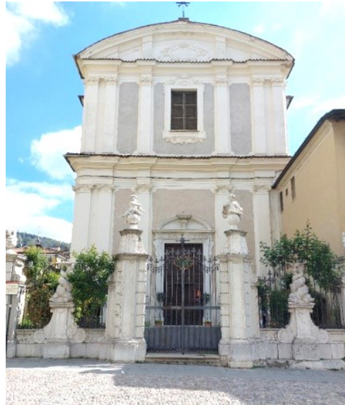
Chiesa di Santa Maria della Carità

Scendendo in via Musei, prima del complesso monumentale di Santa Giulia (non compreso nella visita), si svolta a sinistra in via Giovanni Piamarta per accedere, dopo la scalinata, alla chiesa del Santo Corpo di Cristo con chiostri e la cappella affrescata da Benedetto da Marone. Quest'ultima è definita la Sistina di Brescia per l'affinità con il capolavoro michelangiolesco.