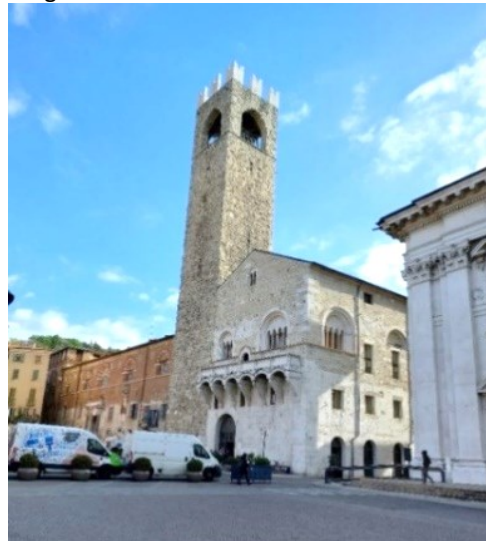
Broletto, Palazzo Novum Majus, torre del Pégol

edifici storici: la facciata tardo-romanico-gotica della chiesa di sant'Agostino, il palazzo Novum Majus con l'ingresso occidentale; la torre del Popolo (torre Pégol ), il Broletto, il Duomo Nuovo e la romanica Rotonda. La visita continua attraversando il Portale di accesso occidentale e nei cortili si trovano: il portico Malatestiano, il loggiato Da Lezze, il palazzo Novum Minus, gli Uffici delle Magistrature Venete e la Porta Orientale.