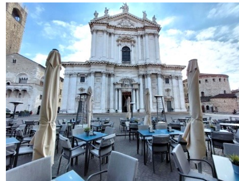
Cattedrale di Santa Maria Assunta: Duomo Nuovo