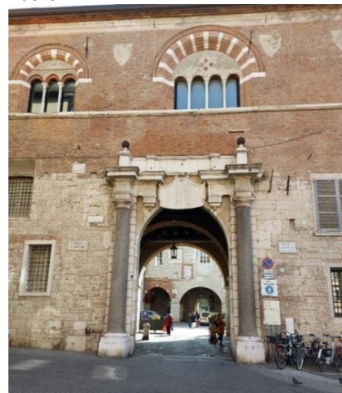
Portale di accesso occidentale del palazzo Novum Majus

Da piazza Paolo VI, per via Cesare Beccaria, si arriva in piazza della Loggia con l'omonimo edificio dove si trovano altre costruzioni cinquecentesche in stile veneziano, mentre al limite meridionale della piazza sono presenti il Monte di Pietà Vecchio, con lapidi recuperate di epoca romana, e il nuovo palazzo del Monte di Pietà. I portici, in stile rinascimentale sono sormontati dalla torre