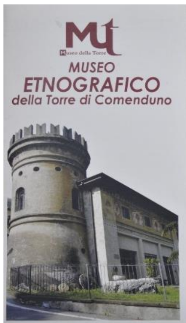
Locandina del museo

La nostra meta è la dependance di Villa Briolini-Regina Pacis dove, dal 1989, ha sede il Museo Etnografico, e dove avremo