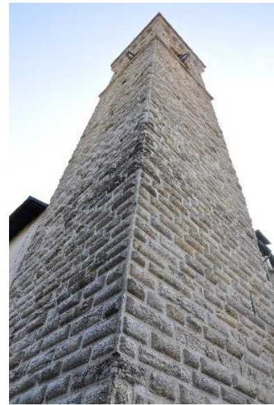
Torre campanaria del XVI sec.

Itinerario di 4 km, per circa 3 ore. Se si proviene da Nembro o dalla Statale del Valle Seriana prendete la centrale via Marconi, al secondo semaforo proseguire a sx. per via Libertà e tenete la sx. per via Aldo Moro, via Generale Dalla Chiesa e via Don Rossi e siete al grande parcheggio del mercato di Albino (Piazza Pio la Torre).