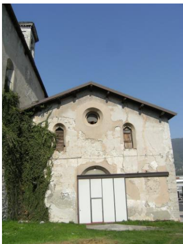
La Chiesa dell'Annunciazione dell'ex convento della Ripa, facciata