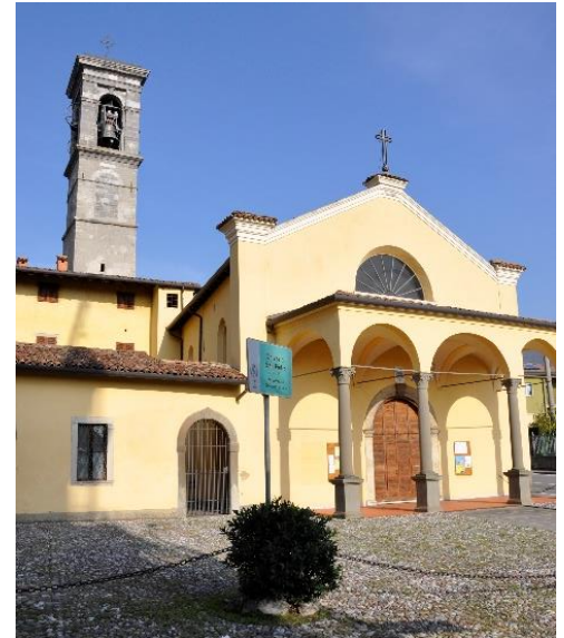
Chiesa di S. Pietro del XV sec.

La chiesa di S. Pietro, più avanti, ci ricorda che siamo a Desenzano di Albino, saliremo verso l'ex Convento Carmelitano della Ripa, in parte restaurato (attiguo è l'edificio della Filanda) per raggiungere la chiesa monumentale di Cristo Re a Comenduno, altra frazione di Albino.