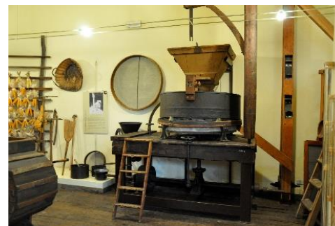
Sala dei cereali

l'occasione di visitare le sale allestite e in particolare l'attuale Mostra dedicata alle Cagère.