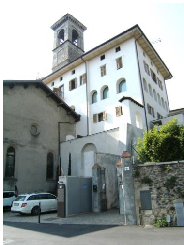
L'ex convento della Ripa da Sud