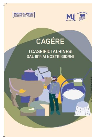
Locandina della mostra i Cagere

Uno sguardo alla Chiesa di S. Maria e S. Elisabetta del XIV sec. con affreschi situate nelle vicinanze del Museo e faremo ritorno al parcheggio.