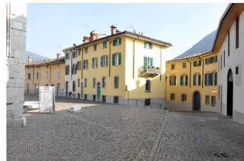
Piazza S. Giuliano