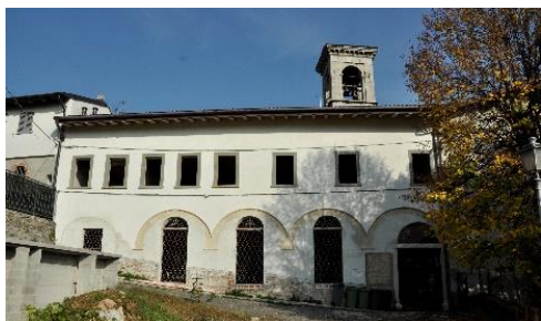
L'ex convento della Ripa, facciata Nord