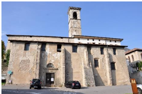
La Chiesa dell'ex convento della Ripa, facciata Sud