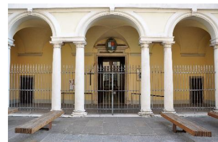
Chiesa di S. Anna

La meta successiva è il Santuario della Madonna del Miracolo, conosciuta come la Madonna della Gamba (della giovane Venturina, del miracolo e delle opere conservate nell'edificio avremo modo di vedere e parlare).