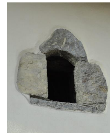
Particolare della chiesa di S. Maria e S. Elisabetta di Comenduno