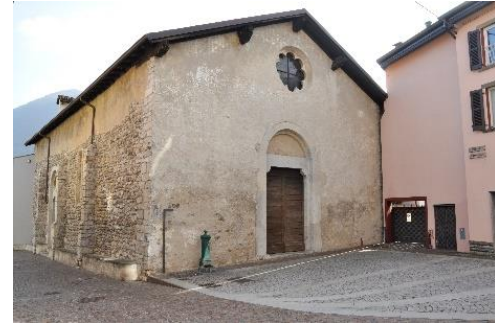
Chiesa di San Bartolomeo del XV sec