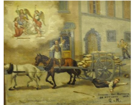
Grazia Ricevuta al Santuario della Madonna del Miracolo

La chiesa di S. Pietro, più avanti, ci ricorda che siamo a Desenzano di Albino, saliremo verso l'ex Convento Carmelitano della Ripa, in parte restaurato (attiguo è l'edificio della Filanda) per raggiungere la chiesa monumentale di Cristo Re a Comenduno, altra frazione di Albino.