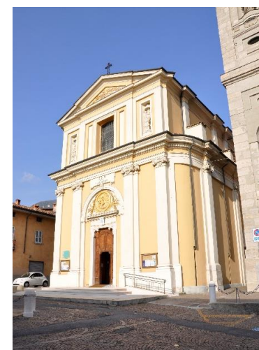
Santuario della Madonna del Miracolo