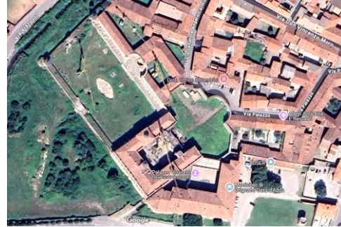
Il complesso di Brignano