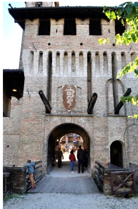
Ingresso del Castello di Pagazzano con l'importante Museo Archeologico.

ritorna poi sul percorso fatto all'andata. A Pagazzano, consigliato, il periplo intorno al Castello.