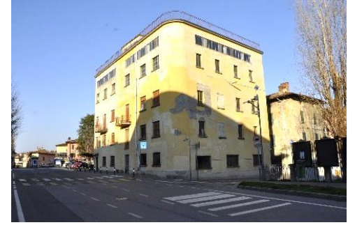
Il Mulino Castelli di Brignano