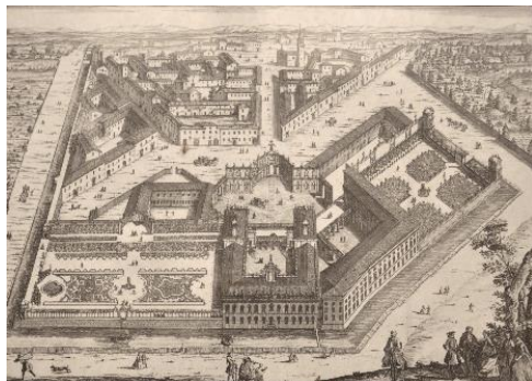
Stampa settecentesca del complesso