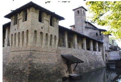
Lato Nord del Castello di Pagazzano