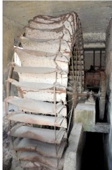
L'antica Ruota del Mulino di Brignano

informazioni e coordinamento prima e durante l'uscita: 3389213848 - 3406987249