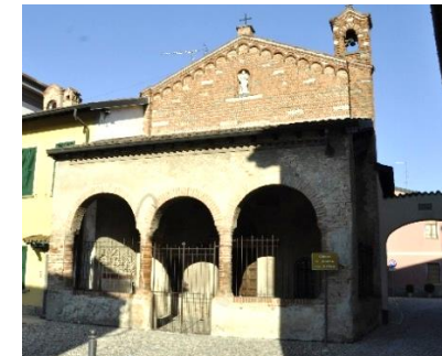
Chiesa di Sant'Andrea a Brignano