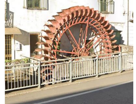
La Ruota Molitoria di Pagazzano