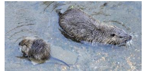
...Gradite o non gradite ci sono anche loro...