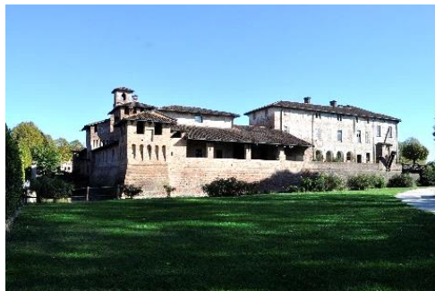
Lato Ovest del Castello di Pagazzano

Dal parcheggio ci sposteremo per osservare la struttura del Castello di Pagazzano: antiche origini, documenti dal IX sec., ricostruzione nel XV sec. Pianta rettangolare, Mastio, Ponte Levatoio, quattro Torrette, Beccatelli, Piombatoi, Fossato... All'interno sorge il Palazzo Visconti-Crivelli del XVIII sec.