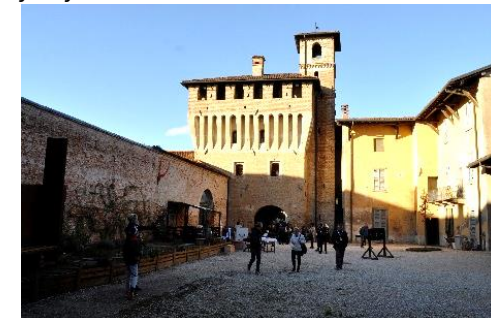
La Corte del Castello