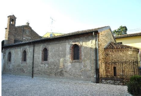
Complesso di Sant'Andrea a Brignano

In sequenza le strutture del Palazzo Visconteo di Brignano, costituito da due palazzi: quello Vecchio del XVI sec. (ora sede del Municipio) e quello Nuovo del XVII sec. Lunga la storia dal 1019, il Barbarossa, i Visconti... fino ai Conti Citterio...: vi rimandiamo alla bibliografia per altre notizie.