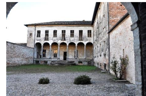
Palazzo Crivelli all'interno del complesso fortificato