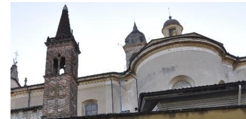
Il complesso della Parrocchiale di Brignano Gera D'Adda