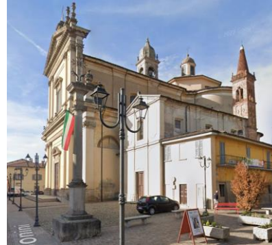
Complesso della parrocchiale di Brignano