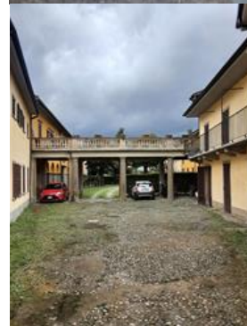
XVI/ XIX sec. Complesso architettonico formato dalla villa Scotti, da rustici e da vasto

giardino nel centro antico. Lo schema della proprietà è costituito da due cortine parallele di edifici separata da una corte allungata. La fronte è alta due piani più sottotetto: al piano terra si aprono finestre quadrate con inferiate e portale ad arco, con stemma in chiave. L'androne conduce a un portico che nella parte centrale è trabeato su colonne e per il rimanente è ad archi su pilastri bugnati, con volte a crociera. All'interno si trovano sale con volte affrescate e soffitti con travi di legno decorati (sec. XVI). Un portico, coperto a terrazza, attraversa la corte collegando il corpo su strada con l'ala interna. Nel fronte a monte un balcone presenta una balaustra curva in ferro battuto e si apre un elegante portico a tre luci con archi su colonne.