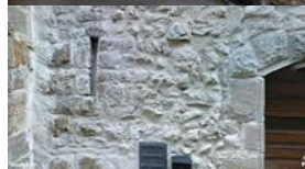
Casa in muratura di pietrame e ciottoli con cantonali in conci bugnati. Presenta una feritoia difensiva e trasformazioni.