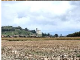
Edificato nel 1482 dalla famiglia Mangili/ Scotti. E' situato in fondo ad un lungo e scenografico viale alberato, subi numerose modifiche.