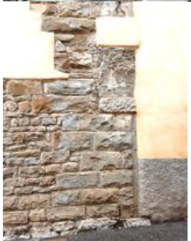
Sulla cinta trecentesca difendeva la porta adiacente di cui è visibile l'imposta di un arco. Ora rimane inglobata in un edificio.