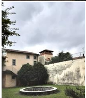
In contrada S. Rocco, TORRE VIA CARAVINA