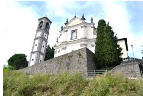
Parrocchiale di S. Michele di Mapello

Prima sosta alla chiesa degli Alpini, con il campo dedicato ai Caduti delle Guerre (Madonna dei Cerri, chiesetta legata alla peste).