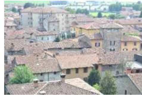
Centro storico di Mapello con alcune delle sue numerose torri.