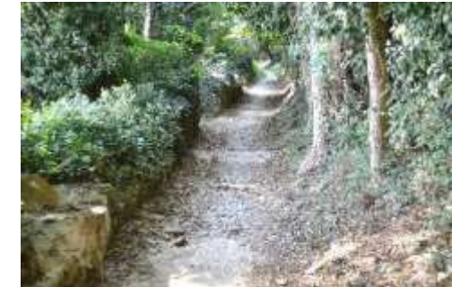
Sentiero verso l'Abbazia

Siamo ormai in vicinanza dell'abbazia di S. Egidio (sentiero e poi strada asfaltata), annunciata dal suo possente campanile (molto restaurato) e dal panorama sulla pianura (Calusco e la cupola della parrocchiale, la cimiteria Italcementi; col sereno possibile la visione di Milano) pochi passi e siamo a Fontanella. L'abbazia romanica di S. Egidio del X sec. e gli edifici meritano una visita.