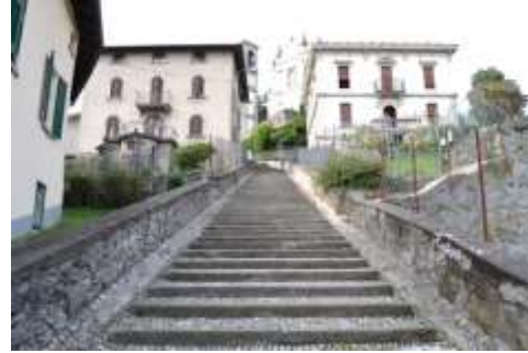
Scalinata per la chiesa di S. Michele

CAI), che porta prima al cimitero (fondo cementato) e poi nel mezzo di un interessante bosco (larga sterrata); si percorre la costa levante del primo tratto del monte Canto, in vista di Ambivere e della val San Martino.