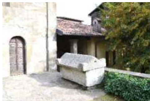
Sarcofago sul Sagrato