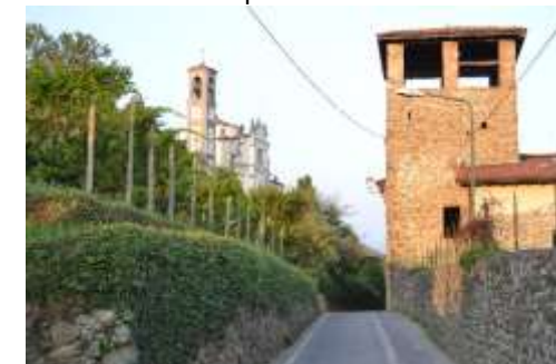
Mapello, Torre dello Stallone

(tutti i sentieri portano a Mapello: sentiero Volpera, via dei colli, Cà Vena). Nel tragitto in discesa si osservano degli imponenti muri a secco di contenimento o terrazzamento di notevoli dimensioni (già visti in altri luoghi, blocchi fatti scivolare dalle antiche cave, le leggende raccontano che sono opera di giganti) e l'interessante alveo di un torrente, anch'esso con enormi massi che inducono a osservazioni geologiche. Si arriva al nucleo di Volpera. Da lì, tra i vigneti e boschi, tenendoci sulla sinistra, si arriva a Mapello. Ci si può dirigere verso santuario della Prada (c'è anche un piccolo lago e nelle vicinanze villa Martinelli) o continuare per il centro abitato. A accogliervi la Torre dello Stallone; meritevoli gli altri edifici del centro storico con interessanti torri medioevali che abbiamo visitato in precedente itinerario. Pochi passi e siamo tornati al punto di ritrovo.