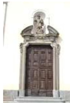
Portale della chiesa di S. Michele

Prima sosta alla chiesa degli Alpini, con il campo dedicato ai Caduti delle Guerre (Madonna dei Cerri, chiesetta legata alla peste).