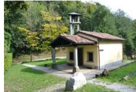
Chiesetta degli alpini