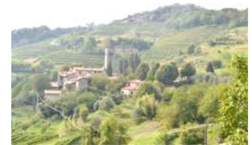
Il complesso dell'abbazia di S. Egidio

Siamo ormai in vicinanza dell'abbazia di S. Egidio (sentiero e poi strada asfaltata), annunciata dal suo possente campanile (molto restaurato) e dal panorama sulla pianura (Calusco e la cupola della parrocchiale, la cimiteria Italcementi; col sereno possibile la visione di Milano) pochi passi e siamo a Fontanella. L'abbazia romanica di S. Egidio del X sec. e gli edifici meritano una visita.