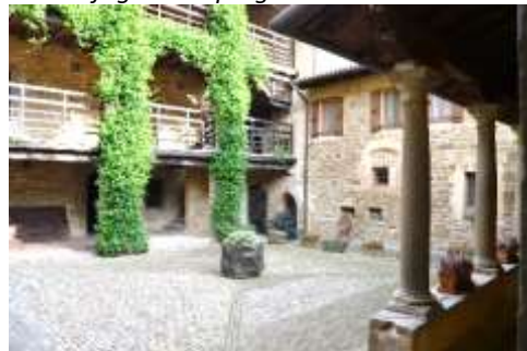
Chiostro dell'Abbazia di S. Egidio