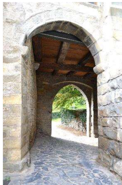
Androne d'ingresso all'Abbazia