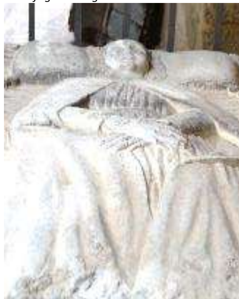
Il sarcofago di Teiperga nel chiostro