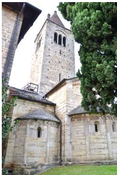
Absidi e campanile dell'abbazia di S. Egidio