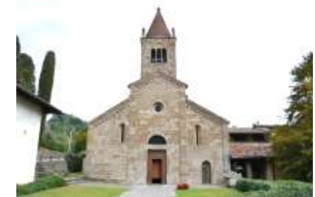
Facciata dell'Abbazia di S. Egidio a Fontanella (molto restaurata)