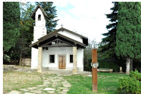
La Chiesetta degli Alpini