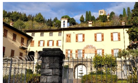
Cà Maitino dal XV sec., Roncalli poi Scotti

Il nostro primo riferimento è il Santuario, con Museo dedicato a Papa Giovanni e Chiesa Parrocchiale, che val la pena di visitare. Dopo un breve tratto in salita, si arriva a Ca' Maitino, villa signorile dei marchesi Scotti risalente al XV sec., donata a Giovanni XXIII e ora altra Casa-Museo dedicata al Pontefice. La salita ci porta alla Torre difensiva medioevale del IX sec. trasformata già nel XIV in Torre Campanaria. Scenderemo dalla parte opposta del colle, sulla sinistra troviamo un edificio di fine '800 con la Cappella di San Rocco. Si ritorna verso la Casa-Museo Roncalli per raggiungere la Chiesa di Santa Maria, risalente al XV sec., che racchiude dipinti e affreschi di pregio. Nelle vicinanze troviamo la Casa Natale del Papa (Cascina Palazzo) che non mancheremo di visitare. Fuori dall'itinerario spicca il Santuario della Madonna delle Caneve.