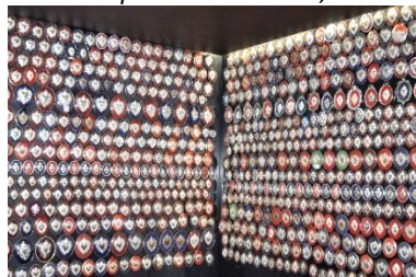
Le Grazie ricevute esposte al Santuario

Il nostro primo riferimento è il Santuario, con Museo dedicato a Papa Giovanni e Chiesa Parrocchiale, che val la pena di visitare. Dopo un breve tratto in salita, si arriva a Ca' Maitino, villa signorile dei marchesi Scotti risalente al XV sec., donata a Giovanni XXIII e ora altra Casa-Museo dedicata al Pontefice. La salita ci porta alla Torre difensiva medioevale del IX sec. trasformata già nel XIV in Torre Campanaria. Scenderemo dalla parte opposta del colle, sulla sinistra troviamo un edificio di fine '800 con la Cappella di San Rocco. Si ritorna verso la Casa-Museo Roncalli per raggiungere la Chiesa di Santa Maria, risalente al XV sec., che racchiude dipinti e affreschi di pregio. Nelle vicinanze troviamo la Casa Natale del Papa (Cascina Palazzo) che non mancheremo di visitare. Fuori dall'itinerario spicca il Santuario della Madonna delle Caneve.