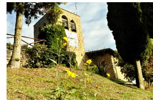
La Torre di San Giovanni