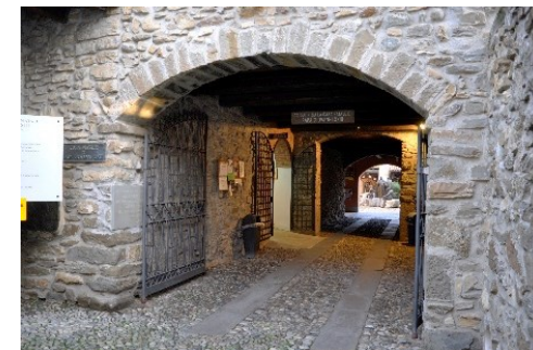
Cascina Palazzo, Casa natale di Papa Giovanni XXIII