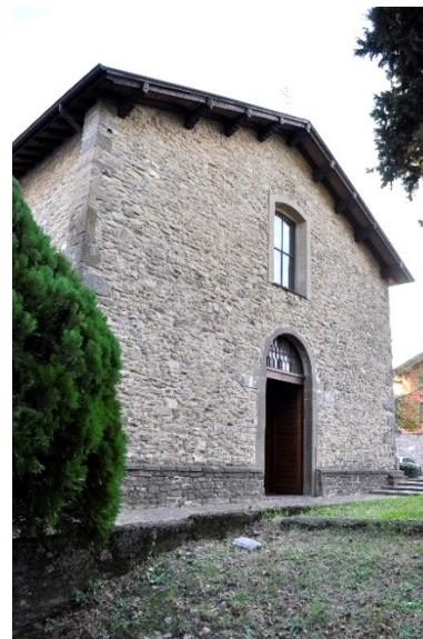
La Chiesa di Santa Maria di Brunico, XV sec.

informazioni e coordinamento prima e durante l'uscita: 3389213848 - 3406987249