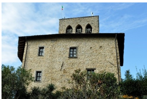
Edificio e Torre di San Giovanni