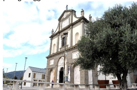
Il Santuario Papa Giovanni XXIII, del XX sec.

e dal 1963, data di morte di Papa Giovanni, il paese è diventato importante meta di pellegrinaggi.