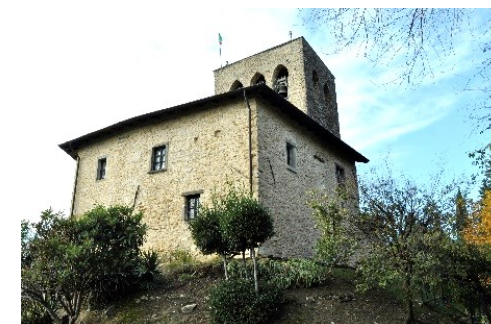
La Torre di San Giovanni dal IX sec., trasformata in Torre campanaria già dal XIV sec.