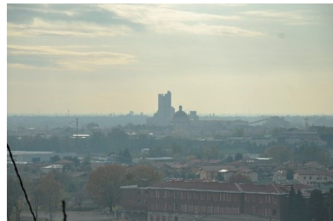
La "torre della cementeria" ex Italcementi di Calusco