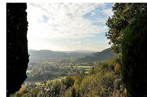
Il Panorama dal Colle di San Giovanni