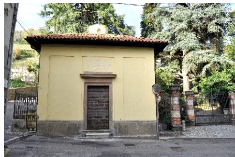
La Cappella di San Rocco