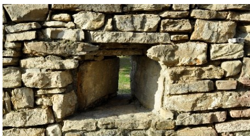
Feritoia della Torre di San Giovanni