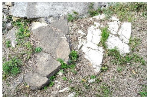
Particolare di emergenza "geologica"