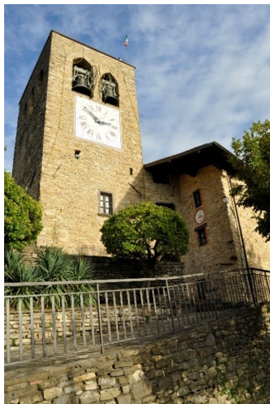
La Torre di San Giovanni