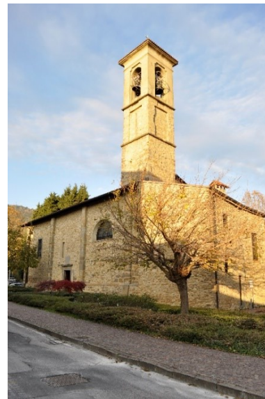
La Chiesa di Santa Maria di Brunico, XV sec.