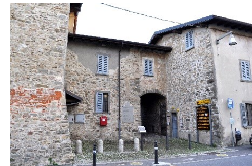
Cascina Palazzo, Casa natale di Papa Giovanni XXIII