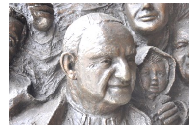
Effigie di Papa Giovanni XXIII

sito: https://www.castrumcapelle.org Facebook: @castrum capelle contatti: castellodibergamo@gmail.com