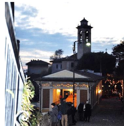
Stazione della Funicolare di San Vigilio