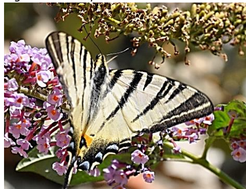
Il Giardino delle Farfalle in allestimento