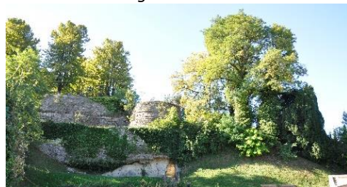
Il parco della Fortezza