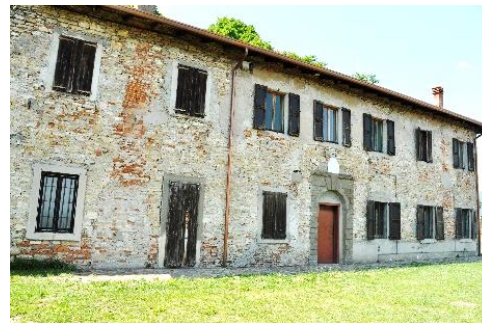
La Casa del Castellano