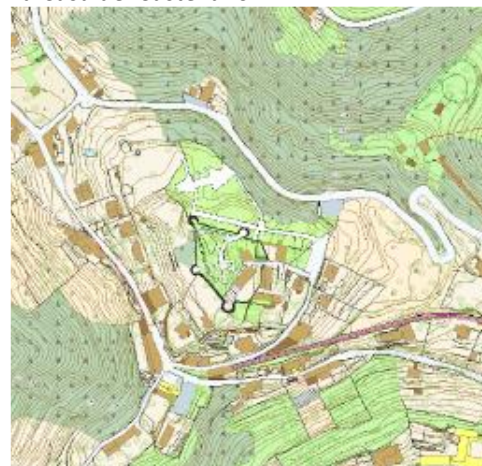
Mappa della struttura fortificata