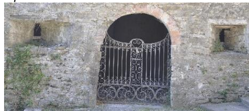
Ingresso del Corpo di Guardia