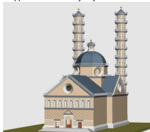
Il progetto rinascimentale per il Duomo di Bergamo di Filarete