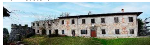
Casa del Castellano (D.M.)