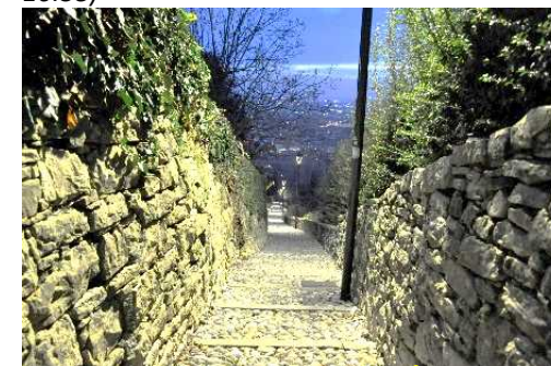
La Scaletta dello Scarlazzino

sito: https://www.castrumcapelle.org Facebook: @castrum capelle contatti: castellodibergamo@gmail.com