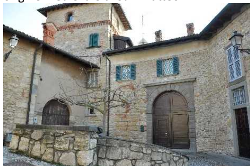
Complesso di San Matteo, già dimora dei Benaglio

Dal parcheggio seguiremo la Via Bassini, poi la Scaletta Bellavista verso il complesso di origine medievale di San Matteo.