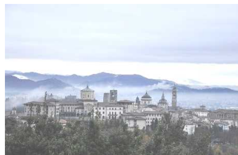
Panorama da via San Martino della Pigrizia