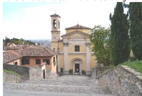
Chiesa di Santa Grata Inter Vites Via Al Castello