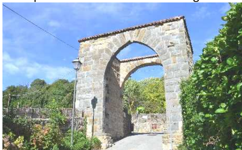
Stongarda o Portone di San Matteo o De Lurbico

Pochi passi e siamo alla Stongarda di San Matteo. La Cappella di San Rocco ci indica la salita per Via San Matteo della Benaglia.