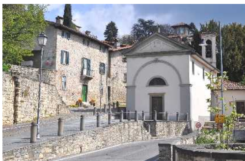
Chiesa di San Martino della Pigrizia