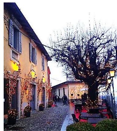
Via Al Castello