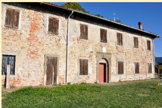
La Casa del Castellano, sede associativa di Castrum Capelle Onlus

Con la ripresa delle attività del 2024 di Castrum Capelle Onlus, cogliamo l'occasione per parlarvi del Castello di Bergamo e fare il punto della situazione della struttura fortificata. Attraverso una serie di immagini rivivremo le vicende storiche del Castello di San Vigilio, per arrivare all'iconografia attuale. Un momento per conoscere le attività e le ricerche fatte e in corso e pensare a nuove proposte.