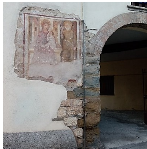
Affresco votivo in via Martinengo Colleoni