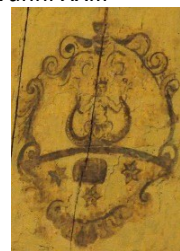
Stemma dei Nobili Carrara