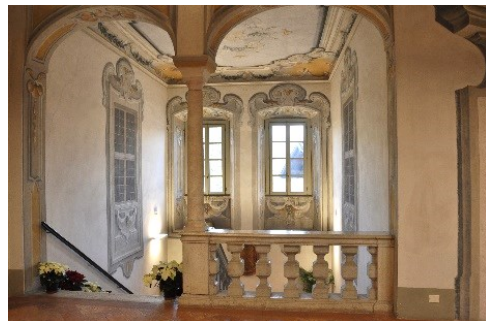
Interno di Palazzo Carrara