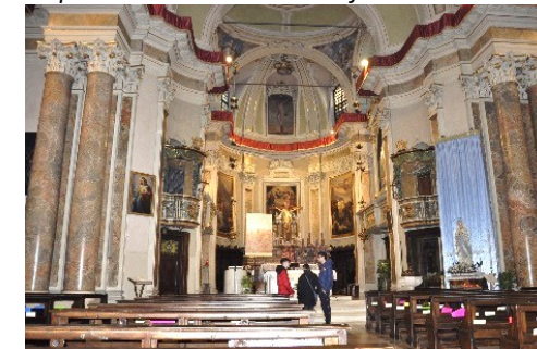
Interno della parrocchiale di Santo Stefano