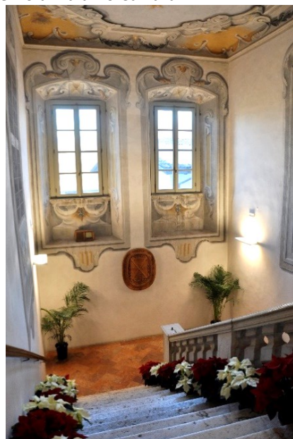
Interno di Palazzo Carrara