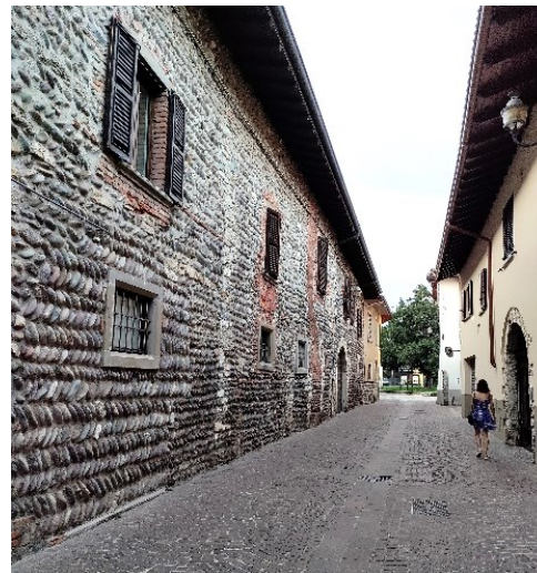
Via Papa Giovanni XXIII