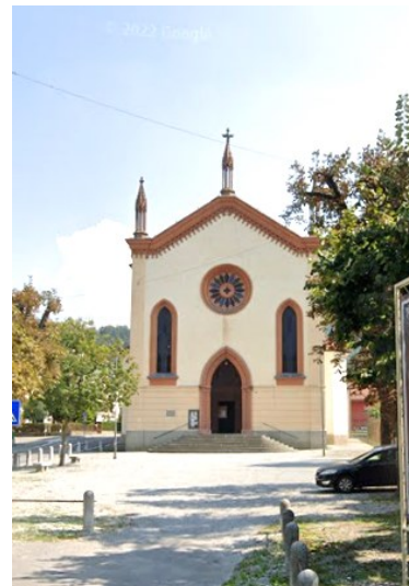
Santuario del Buon Consiglio