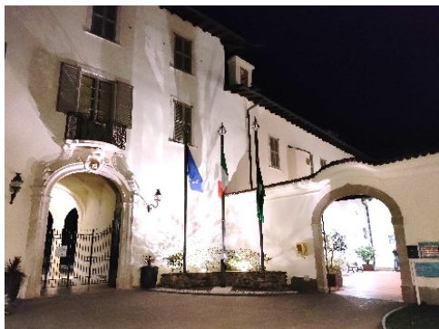
Ingresso di Palazzo Carrara