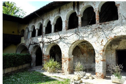
Convento di Santa Maria in Scanzo