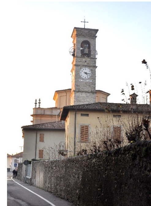
La parrocchiale di Santo Stefano

Torre e altre emergenze architettoniche, fino a Villa Carrara (attuale sede Comunale), per raggiungere poi il Santuario della Beata Vergine del Buon Consiglio (1904): l'edificio comunica, con gradita sorpresa, con l'antico Santuario Mariano risalente al XIII sec.