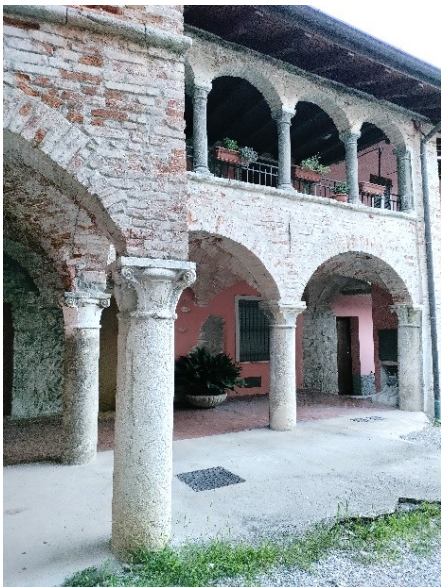
Palazzo rinascimentale in via Papa Giovanni XXIII