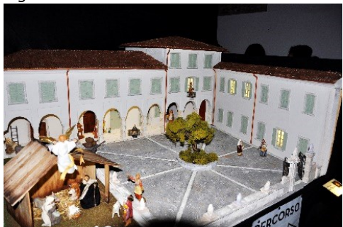
Modellino di Palazzo Carrara