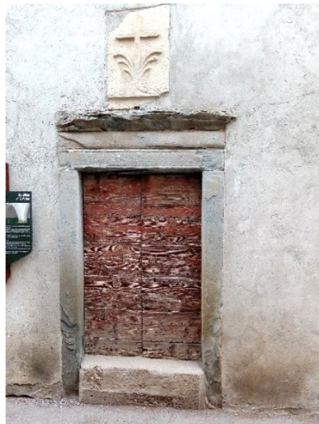
Ex chiesetta di Sant'Anna

Si ritorna sui nostri passi girando a sinistra per via Abadia, e si incontra l'ingresso seicentesco della Villa Brentani, poi la ex chiesetta di Sant'Anna.