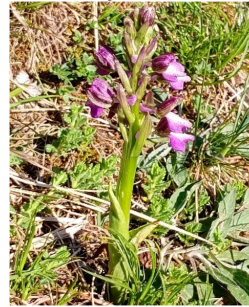
Un esemplare di Orchidea sp