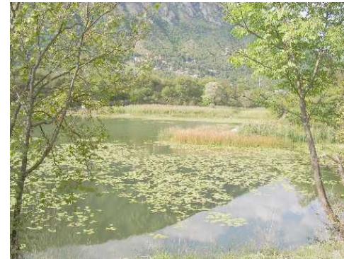
Uno scorcio del Lago di Gaiano