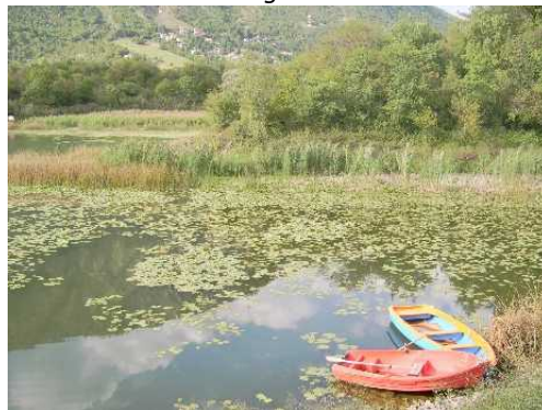
Il Lago di Gaiano e le sue Ninfee