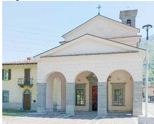
La Chiesa di San Remigio