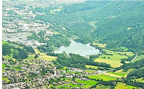
Il Lago di Gaiano

Lago di Gaiano, davvero affascinante. Più avanti l'Ingresso della Riserva Naturale della Valle del Freddo. Non ci dilunghiamo sul particolare ecosistema, le guide sapranno descriverci l'area (servizio gratuito!). La visita dura circa 75 minuti con un minimo dislivello da affrontare. (bar ristoro a 200 m, probabili difficoltà per l'attraversamento della Statale).