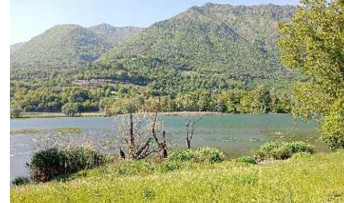
Il Lago di Gaiano