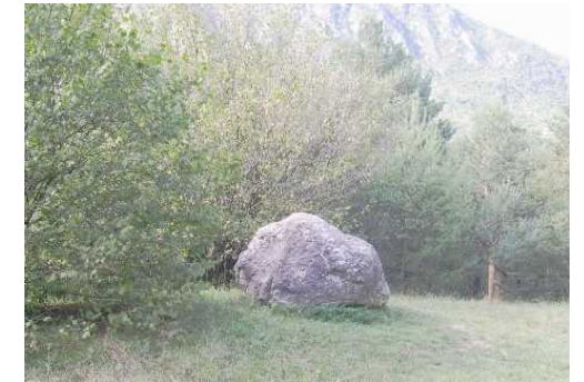
Il Masso Erratico nella Riserva Naturale della Valle del Freddo

Informazioni e coordinamento prima e durante l'uscita: 3389213848 - 3406987249