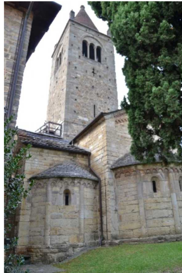
Abbazia di Sant'Egidio di Fontanella

Il borgo di Canto affonda le sue radici all'epoca della costruzione dei monasteri di Pontida e di Fontanella.