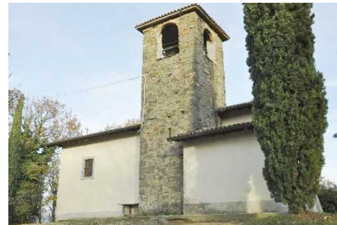
La Chiesa di Santa Barbara I Ruder del Borgo Canto: