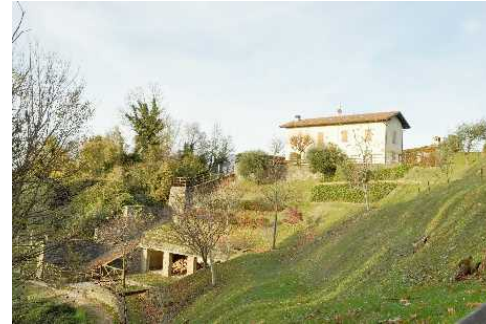
Verso la Cima del Canto