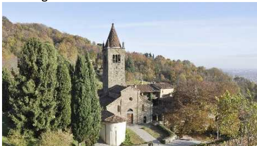
Abbazia di Sant'Egidio di Fontanella