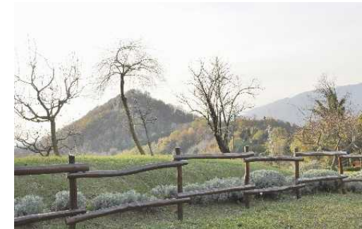
Il Monte Canto