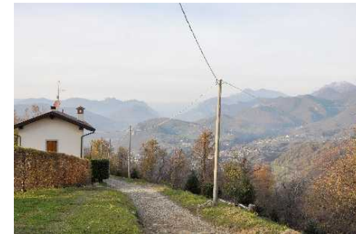
La Val San Martino

informazioni e coordinamento prima e durante l'uscita: 3389213848 - 3406987249