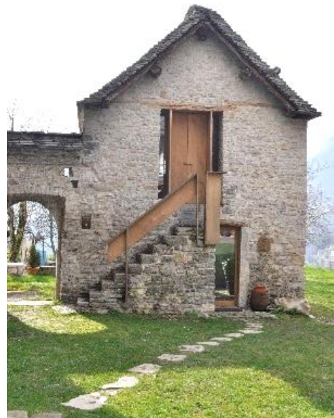
Edificio (ora spazio di lettura) con il caratteristico tetto a Piòde