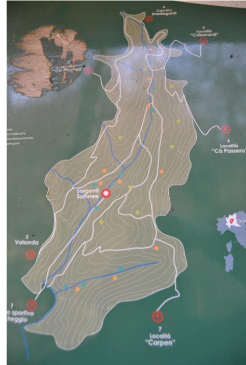
La valle del Brunone

Saliremo lungo i sentieri della Valle fino alle sorgenti solfuree per ritornare al punto di partenza sulla sponda opposta. Rimane da vedere al punto di partenza un edificio: altra storica sorgente di acqua.