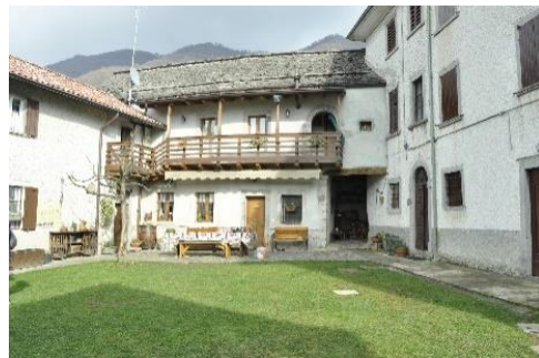
Corte a Roncaglia