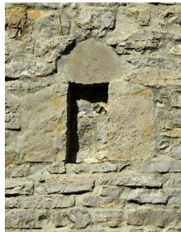
Finestra medioevale a Roncaglia, prob. XII sec.