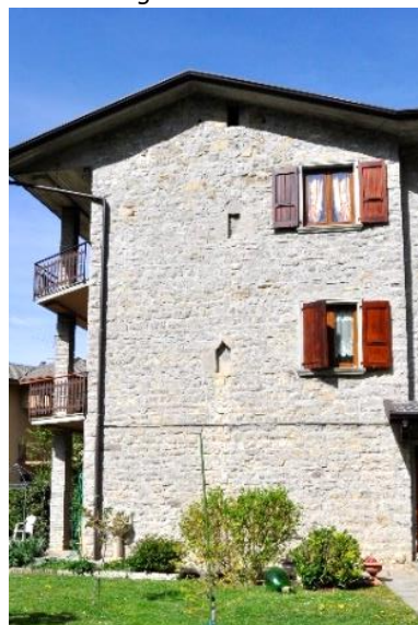
Casatorre a Roncaglia