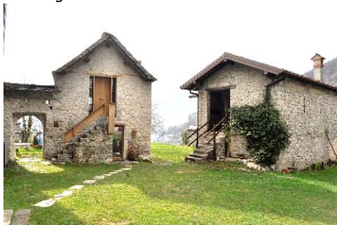
Corte a Roncaglia

pace dove è possibile immergersi in un ambiente umano autentico, ricco di valori e di opportunità per conoscere la storia e la vita del borgo.