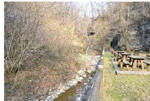
Parco attrezzato all'inizio del percorso