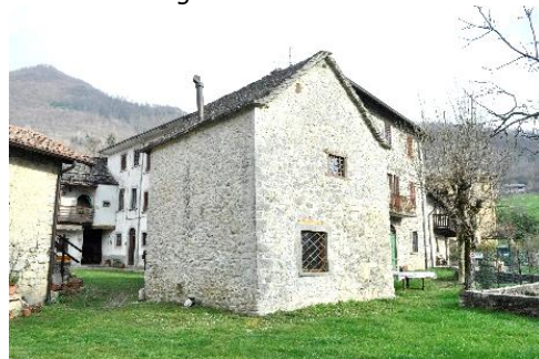
Rustico a Roncaglia