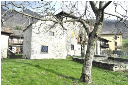
Rustici di Roncaglia