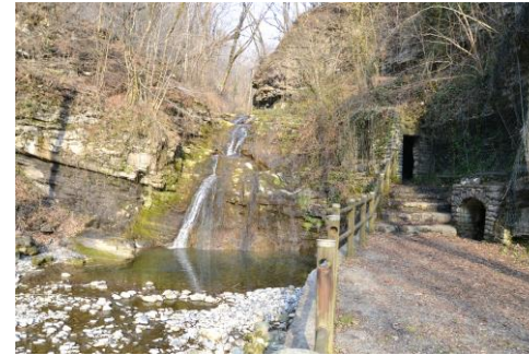
Immagini dai sentieri della valle del Brunone: