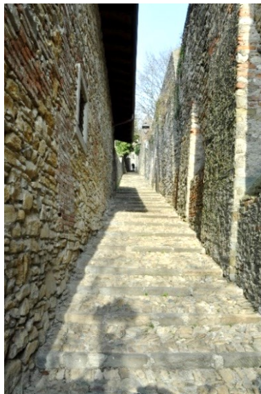
Parte alta di Via Santa Lucia Vecchia. Le murature sulla destra sono parte della Cinta

delle Muraine dei Borghi, come testimoniato anche dalle feritoie difensive presenti