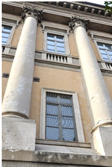
Via Rosate, colonne del Palazzo Sarpi del Crivelli, neoclassico (già Convento di Rosate)