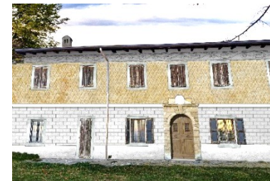
Ipotesi di ricostruzione della facciata della Casa del Castellano (Danilo Maffioletti)