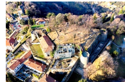
Vista aerea del forte veneziano