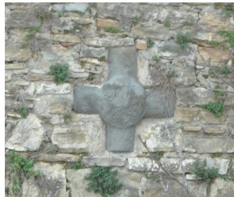
Croce lapidea nella cortina muraria