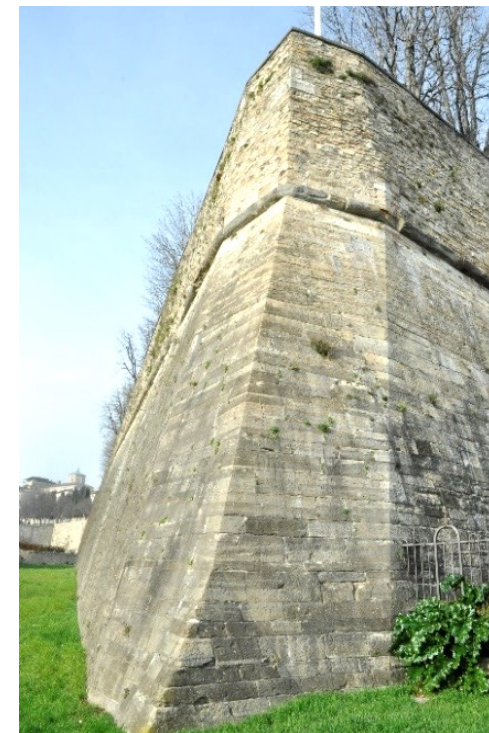
Sperone del Baluardo di San Giacomo