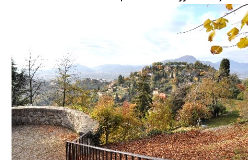
Il Colle della Bastia dal Castello