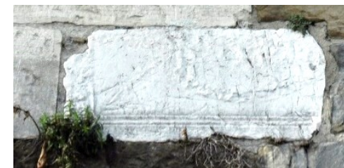
Frammento romano nella cortina delle Mura