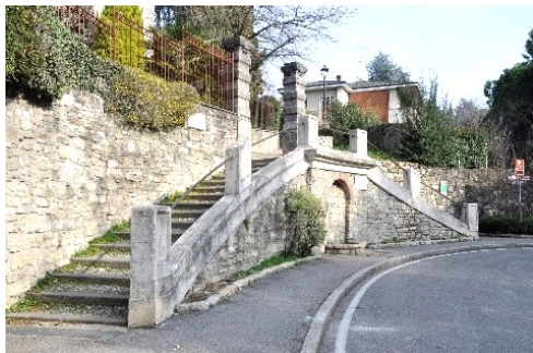
Le due scalinate d'accesso alla salita di Santa Lucia Vecchia

Fra gli ultimi itinerari che ci rimangono da percorrere con meta il Castello di San Vigilio proponiamo la salita dalla Scaletta di Santa Lucia. Il percorso è conosciuto ci limiteremo a descriverlo, alla ricerca di particolari.