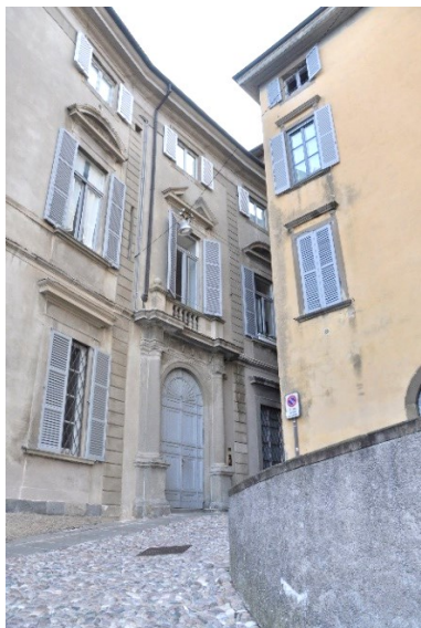
Via San Lorenzo con Palazzo Perini