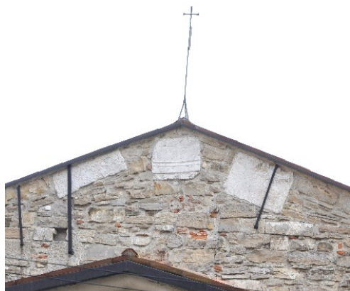
Frammenti romani in pietra di Zandobbio incastonati nella Porta di San Giacomo