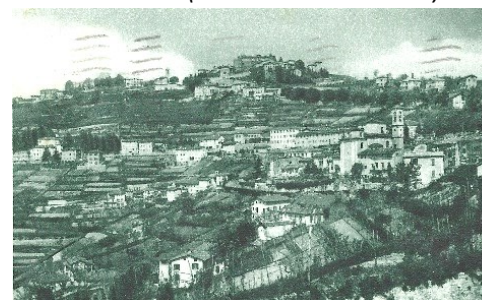
Cartolina del Colle