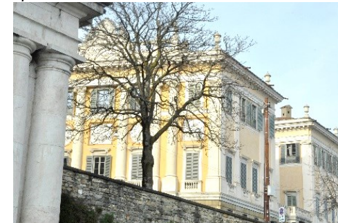
Scorcio di Palazzo Medolago