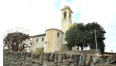
Chiesa di San Vigilio