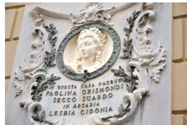
Lapide in memoria di Paolina Grismondi Secco Suardo (la Lesbia Cidonia dell'Arcadia)