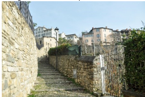
Via Santa Lucia Vecchia

della Guardia di Finanza. Via Santa Lucia con l'omonima Chiesa (ex Convento delle Domenicane di origine trecentesca) ci porta all'inizio della scaletta con Villa Tentorio (Liberty). La salita sbocca in via Tre Armi, al Paesetto, Chiesetta del Giglio e la Porta di San Giacomo ci danno il benvenuto. Nelle cortine murarie non mancheremo di osservare vari conci lapidei romani in pietra di Zandobbio e altri frammenti riutilizzati: ...lunga storia. Saliremo per via San Lorenzino