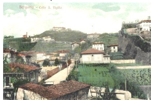
Cartolina del colle, prima della costruzione della Funicolare