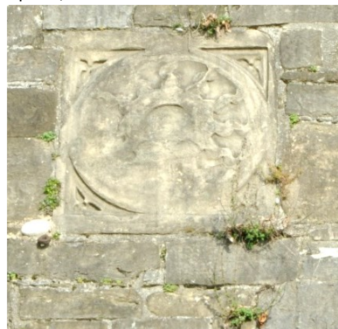
Il Trigramma di San Bernardino scolpito incastonato nel Baluardo di San Giacomo delle Mura