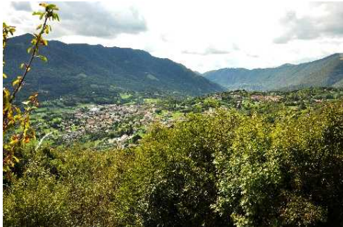
Panorama con Solto Collina