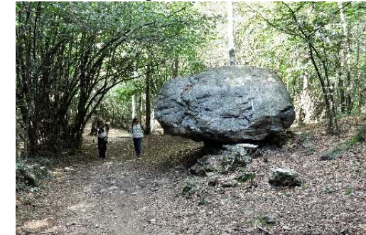
Il Masso Erratico lungo il sentiero