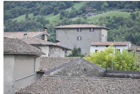
Il Borgo di Dosso con la Casatorre