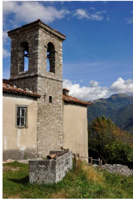
La Chiesa di San Defendente