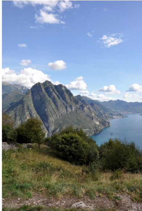
Panorama con il Monte Trenta Passi