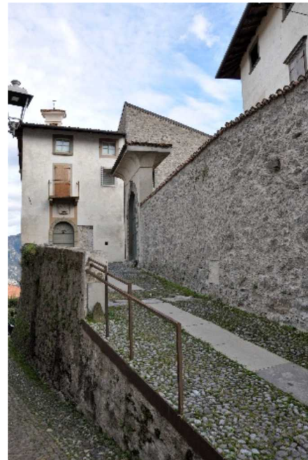
Strutture del Castello