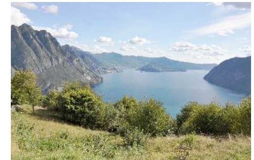
Panorama dall'Eremo di San Defendente