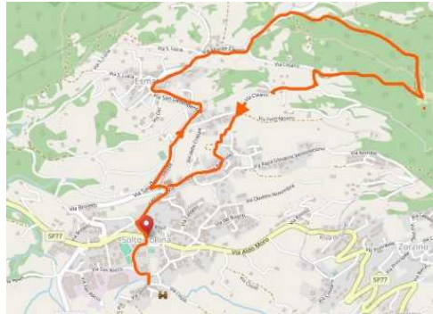
L'itinerario da OSM

dove la strada lascia spazio ad un bel sentiero. Incontreremo una ricostruzione di un Poiat , struttura per la produzione di carbone dalla legna, i Massi Erratici e, infine, l'Eremo di San Defendente, con fantastico panorama. Scenderemo dalla strada di ponente per tornare al punto di partenza. Avremo modo di osservare le imponenti costruzioni di Via Castello, risultato di diverse ristrutturazioni. Un ultimo sforzo per arrivare ai borghi di Sconico, con la Chiesa di San Rocco, e di Dosso con un'importante Casatorre.