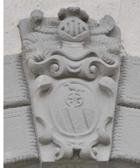
Stemma Araldico al Castello