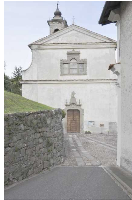
La Parrocchiale di Solto Collina