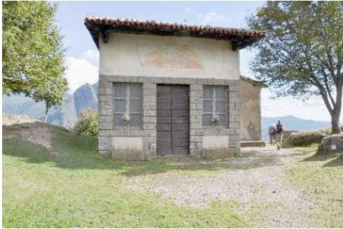
La Chiesa di San Defendente