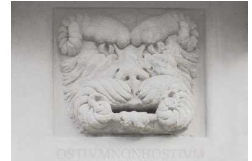
OSTIUMNONHOSTIUM (al Castello)

Castrum Capelle ETS: 163958 (26/01/2026)