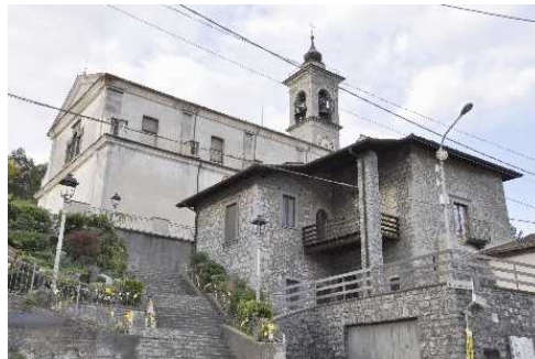
La Parrocchiale di Santa Maria Assunta