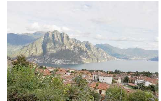
Panorama dal sagrato della Parrocchiale