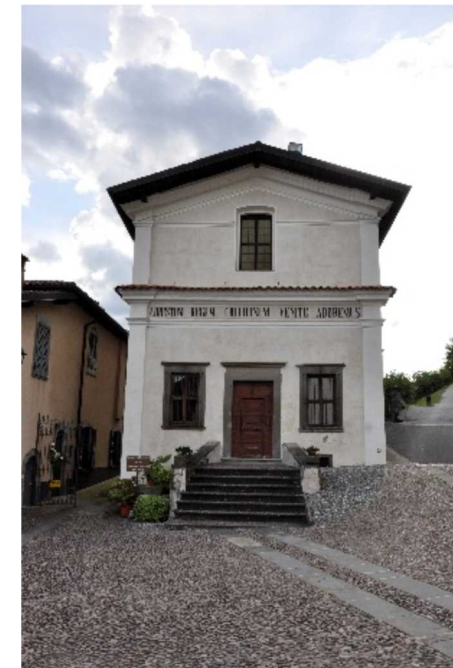
La Cappella del Santo Crocifisso