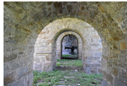
Il viadotto della porta di San Lorenzo

Superata la porta, struttura militare ora sede dell'associazione Orobicambiente, si sale per la via e poi, a destra, per la scalinata che ci conduce alla chiesa di San Lorenzo. Nella piazzetta di fronte si erge la colonna che ci ricorda la scomparsa chiesa di San Lorenzo e fu usata anche come pietra miliare di partenza della brembana via Priula, e l'ingresso della fontana medievale del Lantro. Proseguiremo per il passaggio Becharino da Pratta, un nome e una storia del 1437. Saliamo per via San Lorenzo, con le tracce della porta medioevale, e continuiamo a destra per via Tassis (con palazzo della nobile famiglia dei Tasso) poi per via del Vagine, dominata dall'ex monastero e poi carcere di Sant'Agata; segue la fontana già romana, incastonata nelle mura romane e citata da Mosè del Brolo e l'edificio della calchera . Giungiamo in piazza Mascheroni con la porta del Pantano, e dove possiamo