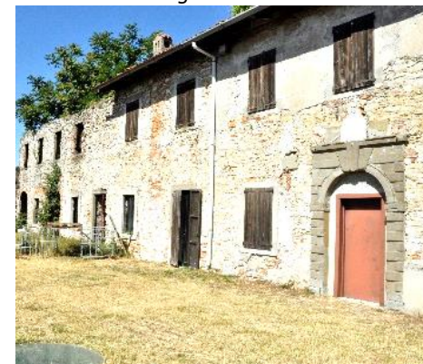
La casa del Castellano