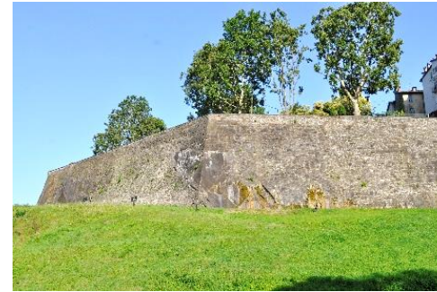
Baluardo di San Lorenzo