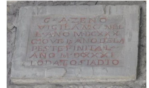
Lapide a ricordo della Peste del 1630

Superata la porta, struttura militare ora sede dell'associazione Orobicambiente, si sale per la via e poi, a destra, per la scalinata che ci conduce alla chiesa di San Lorenzo. Nella piazzetta di fronte si erge la colonna che ci ricorda la scomparsa chiesa di San Lorenzo e fu usata anche come pietra miliare di partenza della brembana via Priula, e l'ingresso della fontana medievale del Lantro. Proseguiremo per il passaggio Becharino da Pratta, un nome e una storia del 1437. Saliamo per via San Lorenzo, con le tracce della porta medioevale, e continuiamo a destra per via Tassis (con palazzo della nobile famiglia dei Tasso) poi per via del Vagine, dominata dall'ex monastero e poi carcere di Sant'Agata; segue la fontana già romana, incastonata nelle mura romane e citata da Mosè del Brolo e l'edificio della calchera . Giungiamo in piazza Mascheroni con la porta del Pantano, e dove possiamo