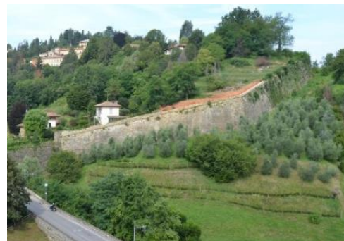
Baluardo di Valverde dalla Montagnetta