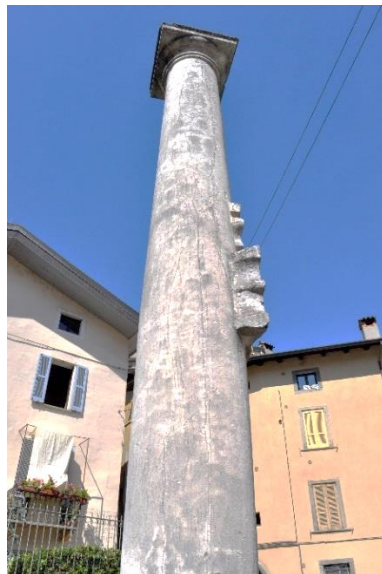
Colonna di San Lorenzo