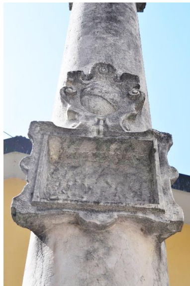
Colonna di San Lorenzo, pietra miliare della brembana via Priula

Informazioni e coordinamento prima e durante l'uscita: 3389213848 - 3406987249