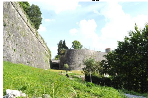
Forte di San Marco