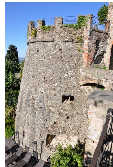
Torrione di San Vigilio