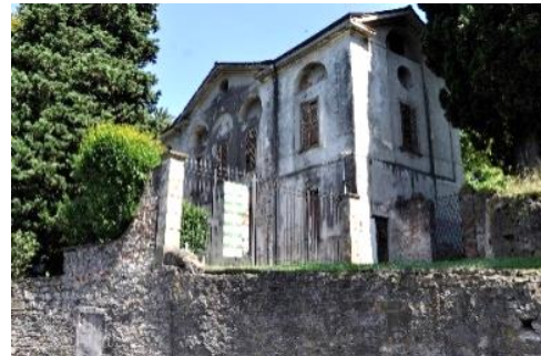
La portineria neoclassica del castello di Valverde