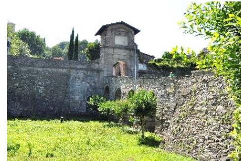
Porta nuova di San Lorenzo