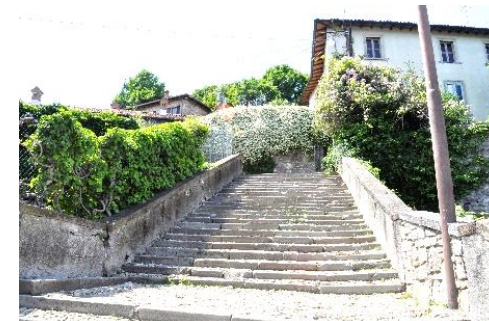
Scalinata di via Al castello