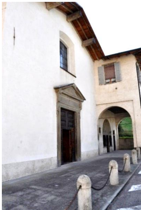
Chiesa di San Lorenzo