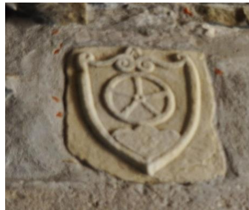
Stemma dei Rota nel Passaggio