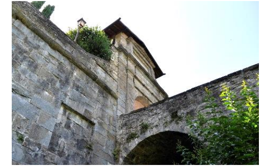
Porta di San Lorenzo