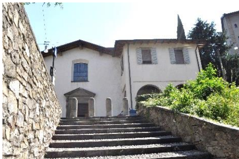
Scalinata di San Lorenzo

dare uno sguardo ai resti romani inglobati nel controverso ex albergo. Salita in Colle Aperto e poi via Beltrami con la polveriera e la lapide per la demolizione del 1907. Imbocchiamo via sotto le Mura di Sant'Alessandro, scendiamo per via Sottoripa e, per le vie San Vigilio e Al Castello, saliamo alla casa del Castellano. Il ritorno può effettuarsi in autonomia o in gruppo lungo via del Roccolino.