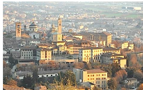
Panorama su Città Alta da via Al Castello