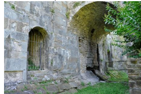
La primitiva porta di San Lorenzo