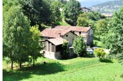
La Cascina dei Sòi

delle Mura con il Baluardo di San Lorenzo, che si appoggia direttamente sulla roccia e, a destra, quello di Valverde che si inerpica sul colle. Solo osservabile la vecchia porta di San Lorenzo (ora Garibaldi) chiusa nel 1605 e ricostruita al di sopra nel 1627. All'ingresso un'insegna ricorda il tempo della Peste e un'altra quella del passaggio di Garibaldi.