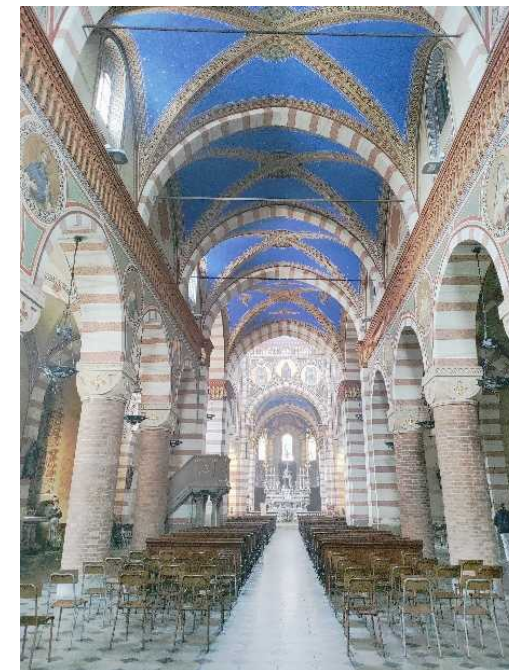
La Chiesa di Santa Maria Assunta

informazioni e coordinamento prima e durante l'uscita: 3389213848 - 3406987249