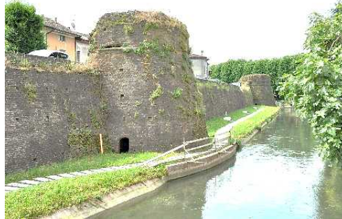
Le Mura di Via Balestieri

Camminamenti. Dedicheremo il resto della mattina alla visita della Filanda Meroni (all'interno ospita il Museo della Seta, ma non è prevista la visita di gruppo). Ritourneremo sui nostri passi per la visione delle strutture esterne della Rocca (lato sud-ovest)