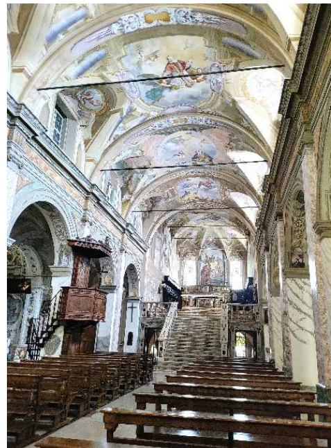
La Chiesa di San Giacomo (interno)