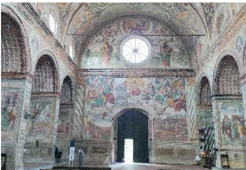
Interno della Chiesa di Santa Maria delle Grazie