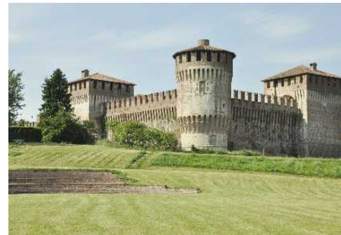
Vista della Rocca dal Borghetto