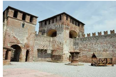
La Corte Interna della Rocca