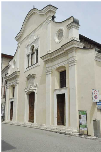
Chiesa di San Giacomo