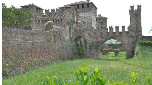
Ingresso e Rivellino della Rocca