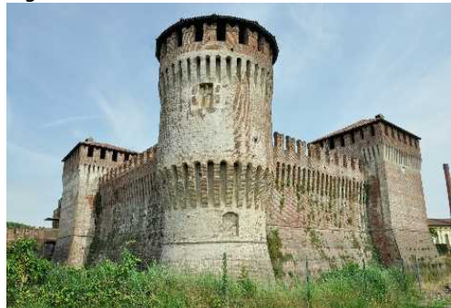
Il Torrione Rotondo della Rocca