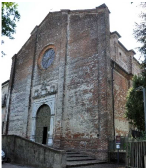
La Chiesa di Santa Maria delle Grazie

Ci sarebbe anche il Museo della Stampa ma non si prevede la visita di gruppo per questioni organizzative.