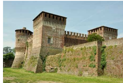
La Rocca dal Fossato