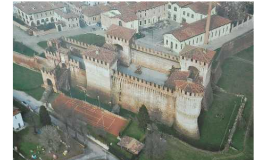
Vista aerea della Rocca (dai pannelli Comunali)