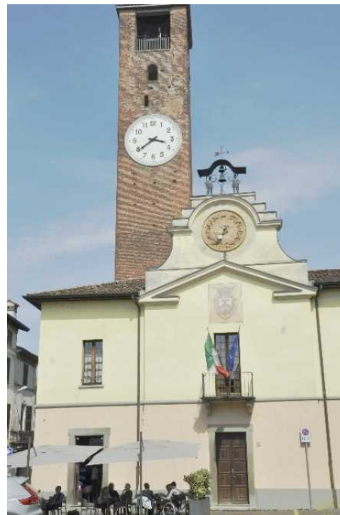
Il Palazzo Comunale con la Torre Civica