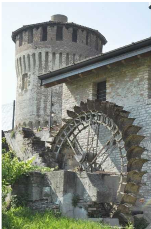
Il Borghetto con il Mulino di San Giuseppe