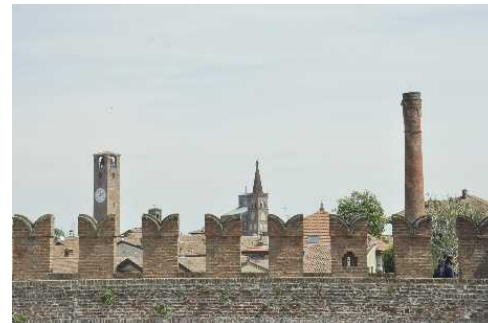
La Torre Civica vista dalle Cortine della Rocca