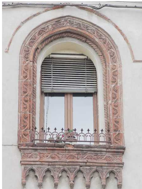
In Piazza Castello – Architetture con caratteristiche formelle di cotto decorate prestampate.

La Chiesa Parrocchiale di San Lorenzo, riedificata su precedente costruzione nel 1776, conserva varie opere di autori del periodo (Peverada, Marigliani, e altri). Quest'anno ricorre il centenario dell'innalzamento del Campanile. Grazie alla disponibilità della Parrocchia sarà possibile effettuare una breve visita. Piazza Castello dove sorge la Chiesa ricorda, come toponimo, la presenza di un Castello, noto fin dall'anno 1000. Alla fine del 1500 era denominata Contrada del Castello.