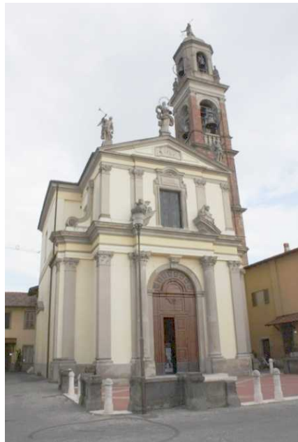
La Chiesa Parrocchiale di San Lorenzo

La Chiesa Parrocchiale di San Lorenzo, riedificata su precedente costruzione nel 1776, conserva varie opere di autori del periodo (Peverada, Marigliani, e altri). Quest'anno ricorre il centenario dell'innalzamento del Campanile. Grazie alla disponibilità della Parrocchia sarà possibile effettuare una breve visita. Piazza Castello dove sorge la Chiesa ricorda, come toponimo, la presenza di un Castello, noto fin dall'anno 1000. Alla fine del 1500 era denominata Contrada del Castello.