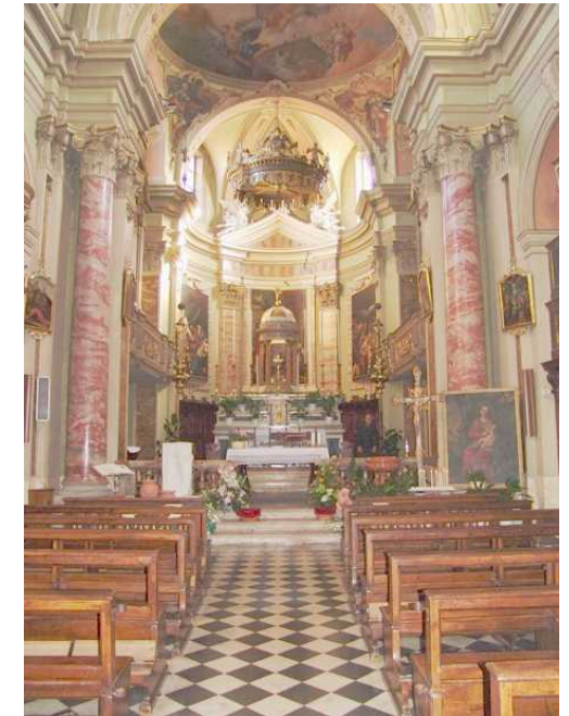
Interno della Chiesa di San Lorenzo

Ritornando sopra la Ripa del Brembo osserveremo le Casematte della ditta di fuochi pirotecnici della Famiglia Martinelli, storico sodalizio marianese che ha operato con i fuochi di artificio fin dal 1700. Significativa è la presenza di una Edicola intitolata a Santa Barbara protettrice dei pirotecnici, dei minatori e di coloro che operano con il fuoco e strumenti incendiari.