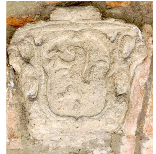
Piazza Castello - Antico stemma nobiliare sulla facciata dell'ex Casa Parrocchiale

È doveroso ricordare, terminando la camminata, il tributo che Mariano pagò durante il tragico bombardamento aereo del 6 luglio 1944. Su 281 vittime ben 33 furono quelle residenti a Mariano, tra le quali i componenti delle famiglie Cividini (8 componenti), Zambelli (5) e Brambilla (3).