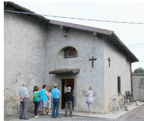
La Chiesina di Santa Caterina presso la Cascina Cimaripa

Il percorso toccherà punti di interesse che riportano all'antico territorio del Comune di Mariano, attraversando il confine amministrativo tra i Comuni di Mariano al Brembo, Sabbio Bergamasco e Sforzatica soppressi nel 1927, in favore dell'istituzione del nuovo Comune di Dalmine.