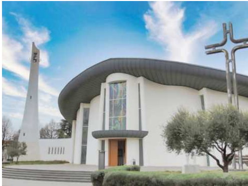
La Chiesa della Addolorata a Mariano

Percorso di circa 9 km con 40 m di dislivello.