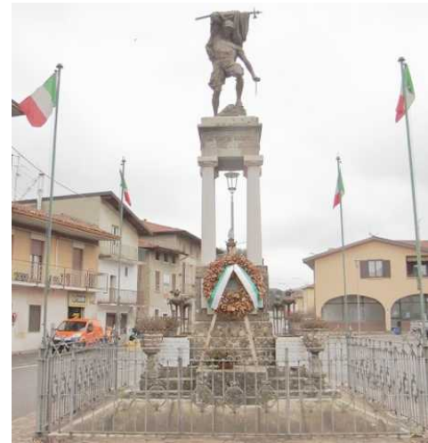
Il Monumento ai Caduti

Prima di chiudere la camminata si transiterà accanto al Monumento ai Caduti edificato nel 1923 in Piazza Vittorio Emanuele II, un tempo Contrada della Piazza.