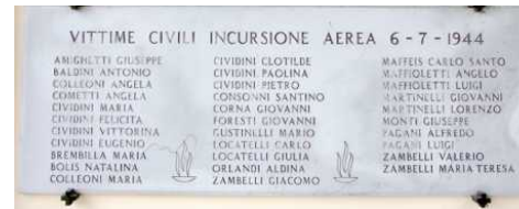
Lapide al Cimitero a ricordo delle vittime marianesi del bombardamento del 6 luglio 1944

È doveroso ricordare, terminando la camminata, il tributo che Mariano pagò durante il tragico bombardamento aereo del 6 luglio 1944. Su 281 vittime ben 33 furono quelle residenti a Mariano, tra le quali i componenti delle famiglie Cividini (8 componenti), Zambelli (5) e Brambilla (3).