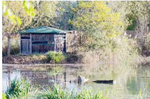
Uno scorcio dell'Oasi del Picchio Verde

dell'Addolorata scolpita nel 1912 dallo scultore Giovanni Avogadri di Bergamo.