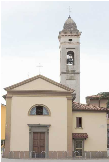
Chiesina dell'Oratorio, già della Madonna dello Spasimo