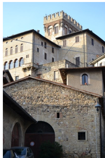
Scheda a cura di Gigi Nava. Bibliografia: 1992 MAESTRONI L. Costa Mezzate, ed Ferrari, 2 vol.