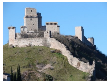
Il castello è assimilabile alla rocca di Assisi

La discesa porta ad un bivio, a destra si procede per Bagnatica, dove sono presenti altri edifici meritevoli, e a sinistra continua per Costa Mezzate, con la visione completa delle strutture del complesso: ( Castello di Costa di Mezzate muri, mura, terrazamenti, la loggia del XVI sec., la chiesa del XVII sec. e il giardino all'italiana) rimaneggiato nel corso dei secoli. Ai piedi la cascina Fui e la parte di ponente del complesso del Rasetto-Zoppi, con altri notevoli edifici.