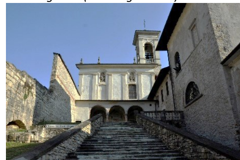
Chiesa del Santo Sepolcro in Astino