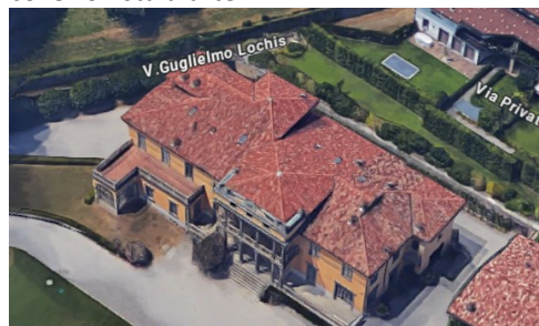
Villa Masnada

A destra si stacca il sentiero della Via pedonale Lochis che sale fino alla Villa di Guglielmo Lochis (1789-1859), politico e collezionista d'arte.