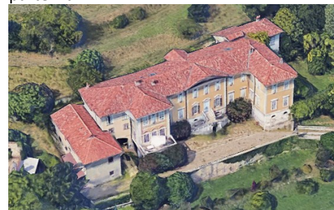
Villa Bagnada

La Chiesa della Madonna del Bosco segna poi la strada che ci porta al Castello Presati (proprietà privata) e, seguendo un'altra strada pedonale, si ritorna al punto di partenza.