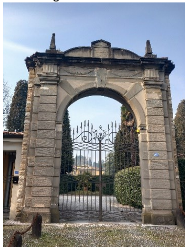
Ingresso monumentale di Villa Masnada

Dal parcheggio ci muoveremo lungo Via Trento tra i confini dei comuni di Curno e Mozzo. Sulla pedonale la Villa Masnada con l'imponente ingresso.