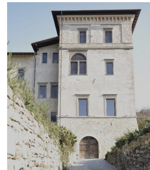
La Torre Belvedere del complesso di Astino