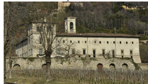
Complesso monumentale di Astino