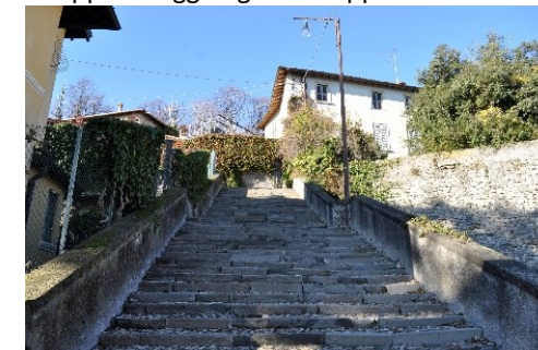
Scalinata al Castello

proseguire lungo la Green Way fino al bivio con via Valverde. Proseguiremo la strada in salita che ci porta alla "Dimora dei Tasso": un edificio legato alla nobile famiglia. All'incrocio con via Castagneta è presente un altro fabbricato interessante, e un particolare "monumento" dedicato all'esoterismo. Si sale lungo la via Castagneta fino alla località Gallina e da lì inizia il Sentiero dei Vasi che ripercorre il tracciato dell'acquedotto medievale della città come testimoniano alcune iscrizioni e numerose opere idrauliche, quali cisterne, condotti sotterranei, "uschioli" e "soradori" e captazioni di sorgive. Salendo per via Ramera giungiamo all'agglomerato delle case Scalvini. Da qui si diramano diverse vie: a destra via Orsarola che porta al colle del Ciaregotto e alla via del Rione, via Vetta con la strada del Sole e via Monte Bastia. Seguendo quest'ultima strada si incontra un antico edificio, la via diventa poi un largo sentiero che ci porta ad ammirare uno dei panorami più belli dei Colli (Astino, il Monte Gussa, l'Isola e la pianura e, a destra, la Val San Martino e la Valle Imagna con l'Albenza). Lungo il percorso scendiamo la scaletta che ci porta alle strutture della villa liberty-eclettica (Villa Viviani, poi Rumi) e al Belvedere di San Vigilio con il Monte Corno. Si sale per via San Vigilio fino alla Chiesa e con un ultimo strappo si raggiunge "La Cappella".