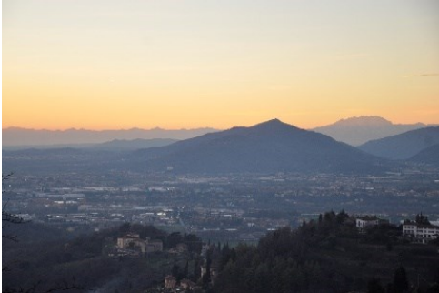
Panorama dalla Piazza Superiore