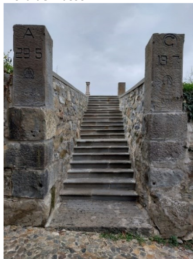
Il monumento esoterico