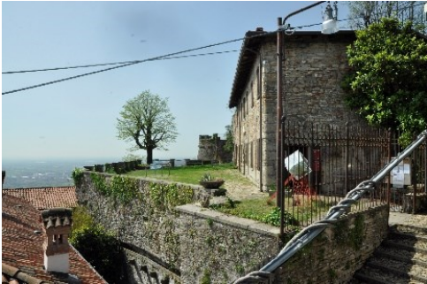
La Casa del Castellano dallo spalto della Casa del Capitano