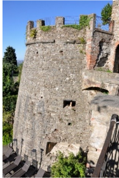
Il Torrione di San Vigilio

Il ritorno consigliato è per via Cavagnis, via sotto le Mure di Sant'Alessandro, il sentiero del Roccolino e rientro per via Mairone da Ponte e via Valverde (tramonto alle Ore 19:23).