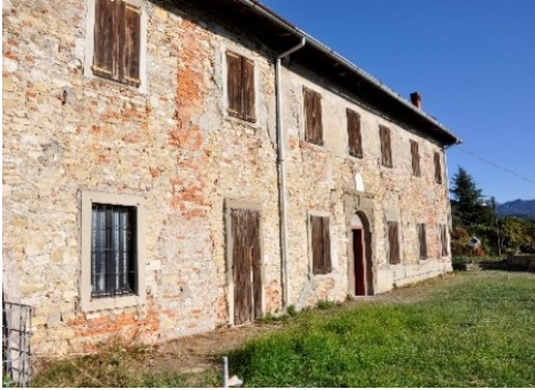
La Casa del Castellano