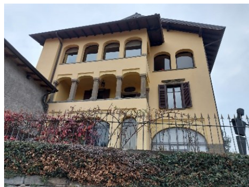
La Dimora dei Tasso