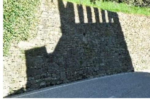
...il castello fantasma...

Il ritorno consigliato è per via Cavagnis, via sotto le Mure di Sant'Alessandro, il sentiero del Roccolino e rientro per via Mairone da Ponte e via Valverde (tramonto alle Ore 19:23).