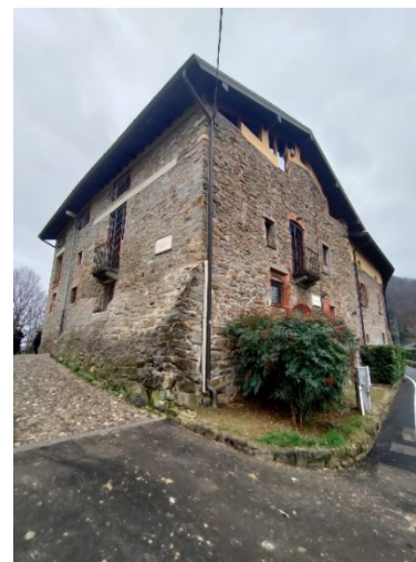
Edificio medioevale in via Castagneta