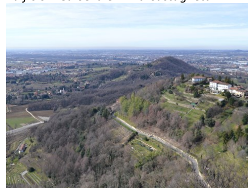
Panorama dal monte Bastia