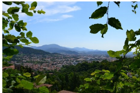
Panorama lungo via Castagneta